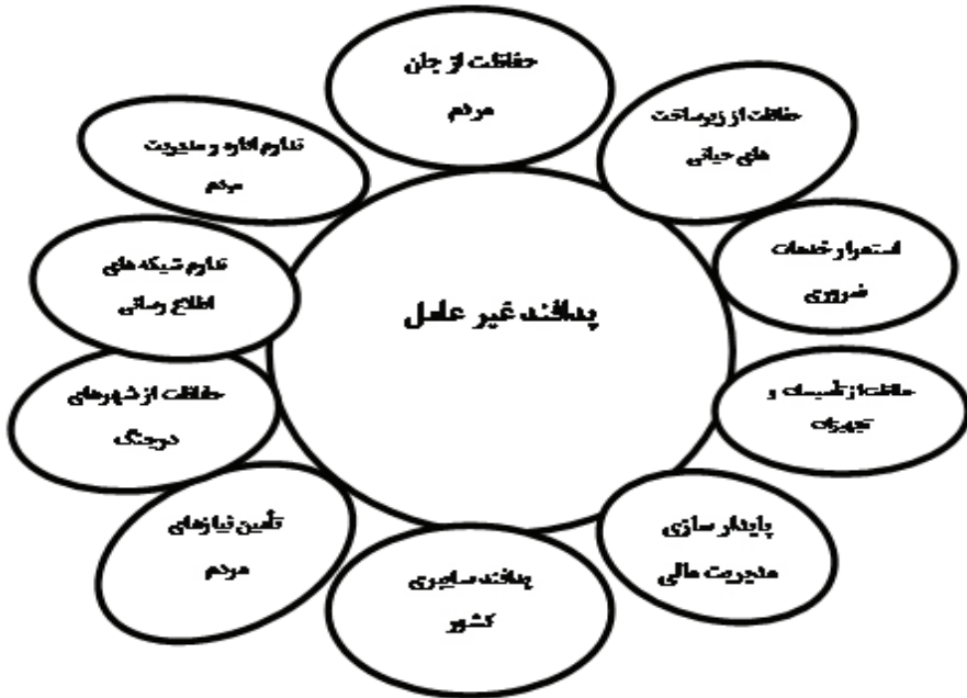
نمودار کارکردهای عمده پدافند غیر عامل

کارکردهای عمده پدافند غیر عامل در سیاست های ابلاغی مقام معظم رهبری (مد ظله العالی) با توجه به تعریف و با استفاده از مفاهیم ارائه شده در سیاست های کلی نظام در مورد پدافند غیر عامل، کارکردهای متفاوتی برای پدافند غیر عامل احصا می گردد که نمودار زیر نشان دهنده آن است: