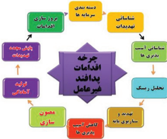
نمودار چرخه پدافند غیرعامل