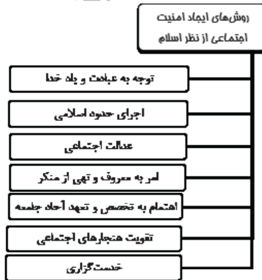
شکل (۱) راهکارهای ایجاد امنیت اجتماعی مستخرج از آیات فوق

حضرت علی (علیه السلام) نیز در فرمان تاریخی‌اش به مالک اشتر در مورد استخدام کارمندان چنین دستور می‌دهد: «ثُمَّ انظُرْ فِي أُمُورِ عُمَالِكَ، فَاسْتَعْمِلْهُمْ اخْتِبَارًا، وَلَا تُؤَلِّمْهُمْ مُحَابَاةً وَأَثَرَةً، فَإِنَّهُمَا جَمَاعٌ مِنْ شُعْبِ الْجَوْرِ وَالْخِيَانَةِ. وَتَوَخَّ مِنْهُمْ أَهْلَ التَّجْرِبَةِ وَالْحَيَاءِ، مِنْ أَهْلِ الْبُيُوتَاتِ الصَّالِحَةِ الْقَدَمِ فِي الْإِسْلَامِ الْمُتَقَدِّمَةِ، فَإِنَّهُمْ أَكْرَمُ أَخْلَاقًا، وَأَصَحُّ أَعْرَاضًا، وَأَقْلُّ فِي الْمَطَامِعِ اشْرَافًا، وَأَبْلَغُ فِي عَوَاقِبِ الْأُمُورِ نَظْرًا» (نهج البلاغه، نامه ۵۳)؛ «سپس در امور کارگزاران حکومت دقت کن و آنان را پس از آزمایش به کارگیر، از راه هوا و هوس و خودرایی آنان را به کارگردانی مگمار، زیرا هوا و هوس و خودرایی جامع همه شعبه‌های ستم و خیانت است. از عاملان حکومت، کسانی را انتخاب کن که اهل تجربه و حیا هستند، و از خانواده‌های شایسته و در اسلام پیش قدم‌ترند، چراکه اخلاق آنان کریمانه‌تر، و خانواده‌ایشان سالم‌تر، و مردمی کم‌طمع‌تر، و در ارزیابی عواقب امور دقیق‌ترند».