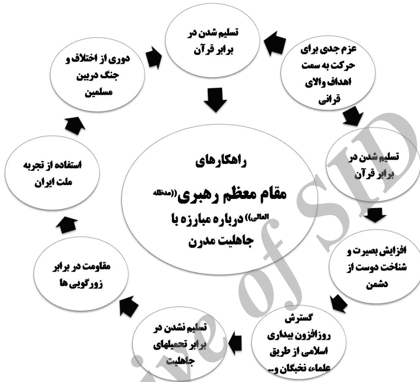
شکل (۲) مدل مفهومی تحقیق: راهکارهای مقام معظم رهبری درباره مبارزه با جاهلیت مدرن

بر اساس قانون نیروی انتظامی جمهوری اسلامی ایران، مصوب ۱۳۶۹/۰۴/۲۶، ناجا دارای وظایف و مأموریت‌های ۲۶ گانه مصرّح است که با بررسی و مطالعه مأموریت‌های پیش‌بینی شده و تطبیق مصادیق و مؤلفه‌های جاهلیت مدرن با این مأموریت‌ها به بررسی حوزه مأموریت‌ها و وظایف ناجا در مبارزه با هر یک از این مصادیق می‌پردازیم.