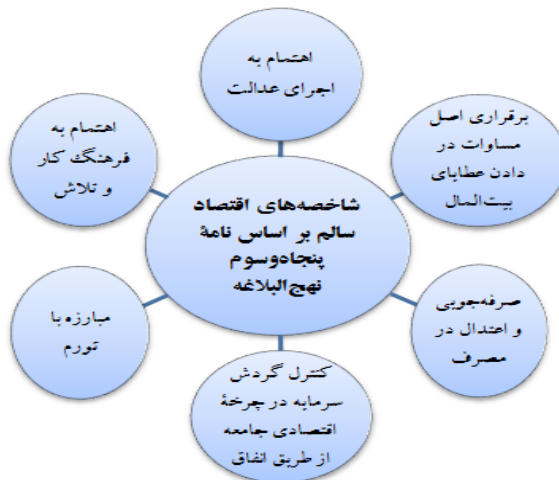
نمودار (۱) شاخصه‌های اقتصاد سالم بر اساس نامه پنجاه و سوم نهج البلاغه

نیاید و آن که بدون آبادانی خراج مطالبه کند، کشور را خراب و مردم را هلاک کند و حکومتش چند روز بیش نپاید. بنابراین، اگر مردم از سنگینی مالیات یا آفت زدگی یا قطع سهمیه آب یا خشک‌سالی یا دگرگونی وضع زمین بر اثر غرقاب، یا بی‌بی‌آبی شکوه کردند، به آنان تا هر قدر که فکر می‌کنی موجب بهبود وضعیتشان خواهد شد، تخفیف بده و مبادا این تخفیف بر تو گران آید، زیرا این کار، اندوخته‌ای است که در آبادانی کشور تو و آراستن ولایت به تو بازمی‌گردد. افزون بر اینکه ستایش آنان را به خویش جلب کرده‌ای و خود نیز از گسترش عدالت در میان آنان به شادی و سرفرازی رسیده‌ای، در حالی که به سبب رفاه و آسایشی که برای آنان فراهم آورده‌ای به توانمندی بیشترشان تکیه خواهی کرد، و به موجب عدالت و رفتار خوشی که آنان را بدان مأنوس کرده‌ای به آنان اطمینان خواهی یافت» (سید رضی، ۱۴۱۴ق: ۴۳۶؛ احمدی میانجی، ۱۴۲۶ق: ۴۸۵/۱).