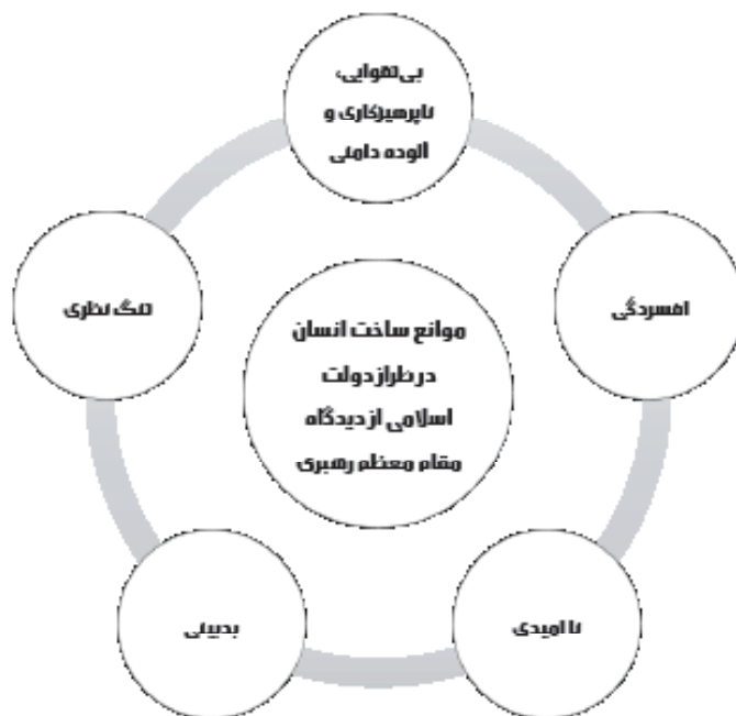
نمودار (۴) موانع ساخت انسان در طراز دولت اسلامی از دیدگاه مقام معظم رهبری

در فرمایشات مقام معظم رهبری نیز می توان مشاهده کرد که معظم له تنها به ترسیم آینده مطلوب و بیان طراز جامعه اسلامی، دولت اسلامی و انقلاب اسلامی بسنده نکرده و موانع تحقق آن را نیز بیان فرموده اند. یکی از این چالش ها - با توجه به رویکرد این پژوهش - معطوف به ساخت انسان در طراز دولت اسلامی است که در نمودار (۴) به آن اشاره شده است: