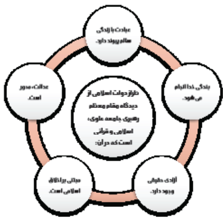
نمودار (۱) طراز دولت اسلامی از دیدگاه مقام معظم رهبری

پلیس یکی از مجموعه‌های نیروهای مسلح جمهوری اسلامی ایران است، به همین دلیل در نگاهی کلان، ابتدا باید چشم‌انداز نیروهای مسلح در طراز اسلامی بنا بر دیدگاه مقام معظم رهبری، ترسیم شود. نمودار (۲) در حقیقت بیانگر نگاه کلی تر معظم‌له از دو زاویه است: نخست اینکه مخاطب ایشان تمامی نیروهای مسلح است و دوم اینکه ایشان از لفظ «نظامی طراز اسلامی» استفاده می‌کنند. طرازی فراتر از طراز جامعه اسلامی، دولت اسلامی و انقلاب اسلامی؛ یعنی در هر سطحی نظامیان باید این خصوصیات را در خود ایجاد کنند.