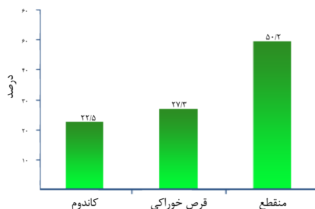
نمودار ۱. فراوانی روش های پیشگیری مورد استفاده در گروه حاملگی ناخواسته