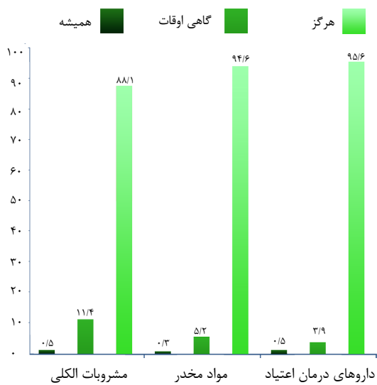
نمودار ۱. توزیع فراوانی سوء مصرف مواد مخدر، مشروبات الکلی و داروهای درمان اعتیاد در بین شرکت کنندگان در مطالعه

قصد مصرف مواد، ۴۶ نفر (۱۱/۹ درصد) سابقه مصرف مشروبات الکلی، ۲۱ نفر (۵/۴ درصد) سابقه مصرف مواد مخدر و ۱۰۲ نفر (۲۶/۲ درصد) مصرف مشروبات الکلی توسط دوستان را داشته اند. ۴۰ نفر (۱۰/۴ درصد) مصرف مواد مخدر و روانگردان توسط دوستان داشته اند، ۴۳ نفر (۱۱/۱ درصد) سابقه مصرف داروهای درمان اعتیاد توسط دوستان را داشته اند ( P=0/001 ) (جدول ۲).