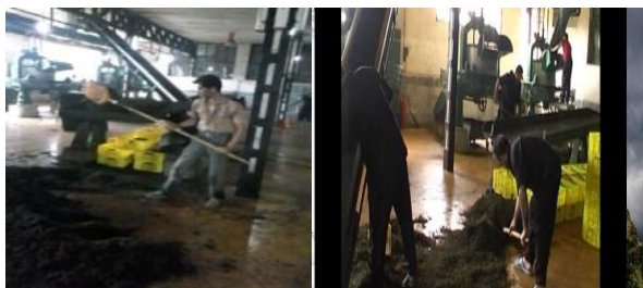
۴- اضافه کردن دسته‌ی زنبیل‌ها برای کشیدن آن‌ها بر روی زمین