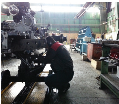
تصویر ۲: تصویر اپراتور خط مونتاژ قبل و بعد از مداخله

نتایج حاصل از پرسشنامه نوردیک قبل و بعد از مداخله در تصویر ۱ آمده است. همان طور که مشخص است اختلالات اسکلتی عضلانی در اندام‌های شانه، بازو، قوزک و پنجه در افراد مورد مطالعه به صفر رسیده است. همچنین در اندام‌های گردن، کمر، مچ و انگشتان، پا و زانو تعداد موارد اختلالات اسکلتی به ترتیب از ۶، ۴، ۵، ۷ به ۳، ۳ و ۳ کاهش یافته است. در مجموع از ۳۰ مورد اختلالات شناسایی شده قبل از مداخله با مداخله صورت گرفته این تعداد به ۱۱ مورد رسیده است (تصویر ۲).