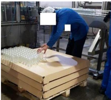
شکل ۴: ایستگاه کاری جای‌گذاری قوطی‌ها در نوار بسته‌بندی