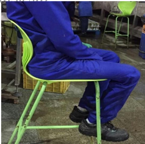
شکل ۲: صندلی‌های بعد از مداخلات ارگونومیکی