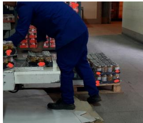
شکل ۳: ایستگاه کاری جای‌گذاری بارها در جعبه‌های بزرگ