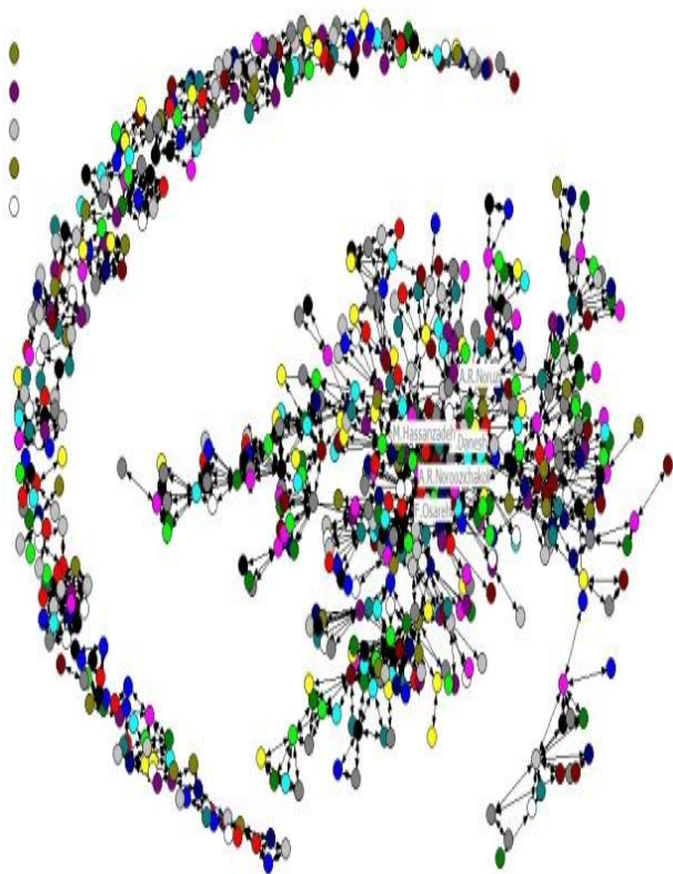
تصویر ۱. شبکه هم‌تالیفی پژوهشگران حوزه‌ی اطلاع‌سنجی

در این مطالعه اندازه گره‌ها، مرکزیت درجه یا تعداد هم‌تالیفی آن گره و قطر پیوندهای موجود میان گره‌ها نشان دهنده تعداد تالیفات مشترک آن دو گره با یکدیگر است. نتایج پژوهش نشان می‌دهد که شبکه هم‌تالیفی پژوهشگران حوزه‌ی اطلاع‌سنجی از تعداد ۶۹۷ گره و ۲۵۵۷ پیوند تشکیل شده است (تصویر ۱). همچنین پنج نویسنده دارای بیشترین تولید در تصویر شماره ۱ مشخص شده‌اند.