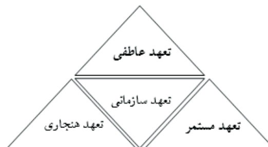
شکل (۲): ابعاد تعهد سازمانی آن و می‌یر

تعهد هنجاری یا تکلیفی بر اساس دین و الزام به ماندن در سازمان دلالت دارد، افرادی که این نوع تعهد در آنها وجود دارد، معتقدند که ادامه فعالیت در سازمان وظیفه و دینی است بر گردن آنها و احساس می‌کنند که باید در سازمان باقی بمانند (پاترسون، ۲۰۰۴).