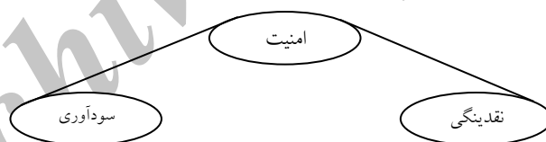
نمودار (۲) مثلث جادویی سرمایه‌گذاری

صاحبان سرمایه و دارندگان منابع و امکانات، افرادی حقیقی یا حقوقی هستند که در صورت وجود شرایط لازم تمایل دارند تا بتوانند در فعالیت‌های کارآفرینانه و اشتغال‌زا شرکت نمایند. البته شکل‌گیری بازارهای سرمایه به صورت یک صنعت نوین و تمایل آنها به سرمایه‌گذاری مخاطره‌آمیز سبب شده تا کارآفرینان نسبت به گذشته با سهولت بیشتری بتوانند برای تحقق افکار و اجرای پروژه‌هایشان به منابع مالی دست یابند (لیولین و همکاران، ۲۰۰۳). یکی از مدل‌های معروف، بیان‌گر اعتقاد و تمایل سرمایه‌گذاران به مشارکت در طرح‌ها و فعالیت‌های کارآفرینانه و اشتغال‌زا، در نظر داشتن مثلث جادویی سرمایه‌گذاری ۲ است. نمودار شماره ۲ مثلث مذکور را نشان می‌دهد. مستند به ابعاد مدل، سرمایه‌گذار در صورتی تمایل به همکاری با استفاده‌کننده از سرمایه‌اش را خواهد داشت که سه شرط مذکور در مدل؛ یعنی امنیت، سودآوری و نقدینگی ۳ برای سرمایه‌اش وجود داشته باشد ۴ . کارآفرین کسی است که می‌تواند در خصوص مطلوبیت نوآوری خویش، صاحبان سرمایه را متقاعد نموده و آن‌ها را با خود همراه سازد (ویک و بستر، ۲۰۰۳).