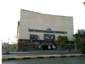
شکل ۱۰- سینما بهمن (فانوس)