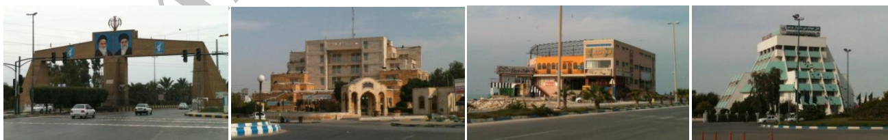
شکل ۴- هتل دلوار (نگارنده) شکل ۵- مجتمع تفریحی تیبو شکل ۶- شهرداری جدید شکل ۷- ورودی شهر

در بوشهر نیز تحت تأثیر موج مدرنیته، طی سالهای گذشته بناهایی با توجه به تفکر مدرن احداث گردیده اند که شامل فروشگاه‌ها، هتل‌ها، ادارات، سینماها و غیره می‌شوند. در اینجا چند نشانه شهری پس از مدرنیته، که در بوشهر شاخص ترند آورده شده است: