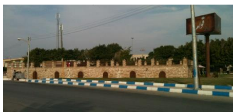
شکل ۱۷- آب انبار قوام- رستوران قوام

اما در این میان برخی از نشانه ها نیز هستند که به همان شکل سابق خود یا با تغییر ماهیت و بعضا شکل ظاهری، در همان مکان به حیات خود ادامه داده اند، مانند: