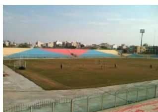
شکل ۱۵- فلکه فرودگاه (معراج)