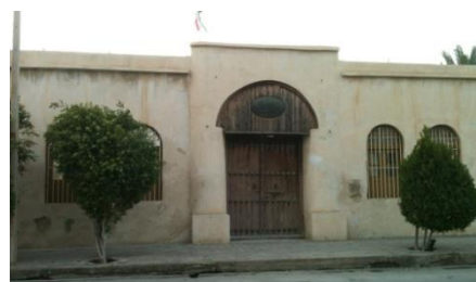
شکل ۲۲- مدرسه سعادت جدید در کنار مدرسه قدیمی