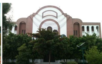
شکل ۱۴- استادیوم فوتبال