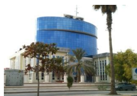
شکل ۹- ساختمان دارایی