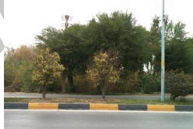
شکل ۱۸- قدیمی ترین درخت بوشهر (بابل) شکل ۱۹- چاه های آندُر بُندُر و درختان کهن بوشهر