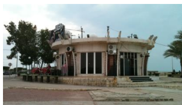
شکل ۱۱- فستفود رافائل