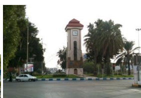
شکل ۸- میدان قدس (ساعت)