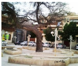
شکل ۲۱- مدرسه سعادت قدیم