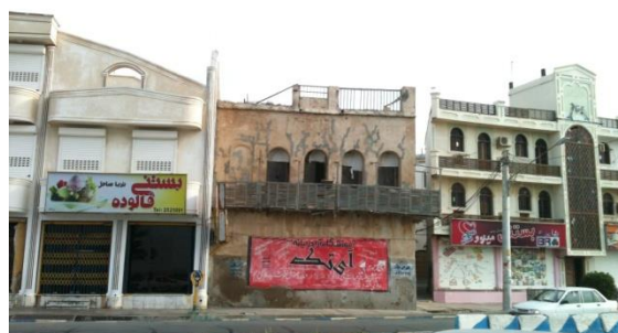
شکل ۳- نمونه‌ای از بی‌توجهی به عناصر بافت تاریخی بوشهر (نگارنده)

در بوشهر نیز این پدیده به وفور_بخصوص در نواحی بافت قدیم شهر و اطراف آن_ قابل مشاهده است. شکل ۳.