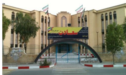
شکل ۲۳- میدان شیخ سعدون