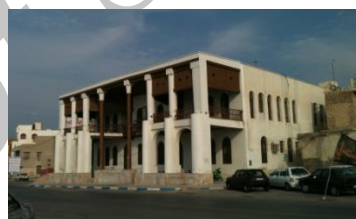
شکل ۱۶- شهرداری قدیم (امیریه)- شورای شهر