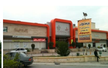
شکل ۱۳- استانداری