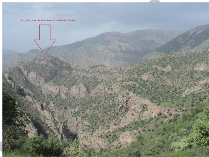
شکل ۳- محل بنای قلعه مشهور به قلعه قبادخان در قسمت شرقی کوه خریو (خریوان)