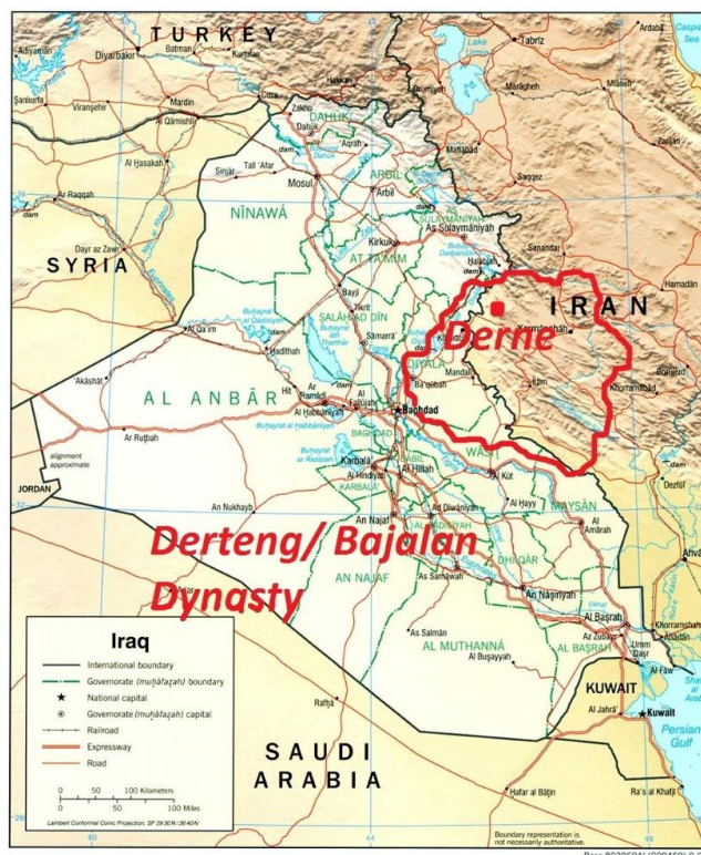
شکل ۲. نقشه تطبیقی امارت در تنگ یا باجلان به مرکزیت درنه در اوج گسترش آن در قرن ۱۶ میلادی

مقاله حاضر اساساً بر اساس روش‌های سنت شفاهی، تاریخ شفاهی (که در آن در حد توان و به نسبت موضوع از رویکرد پست مدرنیست ها ۱ استفاده شده است)، تکیه بر منابع دسته اول و نیز آثار تاریخی تالیف شده است. از گذشته‌های دور همواره شینده می‌شد که در منطقه دول دره (از بکرترین مناطق ثلاث باباجانی) شهری بسیار آبادان وجود داشته به نام درنه که اهالی پا به سن گذاشته داستان‌هایی جذاب از عظمت و کیفیت زندگی مردمان آن شهر تعریف می‌کردند. همین پیشینه مقدمه‌ای شد تا با استفاده از روش تاریخ‌نگاری تاریخ شفاهی و با در نظر گرفتن برخی واقعیت‌های بومی، سوالاتی تنظیم شود و با انجام مصاحبه، اطلاعات اولیه گردآوری شد. سوالات طوری تنظیم شده بود که مصاحبه‌شوندگان خود را در ارائه مطالب کاملاً آزاد می‌دیدند و امکان گسترش دامنه آن و نیز افزایش تعداد مصاحبه‌شوندگان وجود داشت. ابتدا رئیس کلی مطالب بیان می‌شد و سپس بر مبنای آن جزئیات بیشتری تبیین می‌گردید. شاید بزرگترین و متأسفانه جبران‌ناپذیرترین مشکل مصاحبه‌های مذکور جای خالی برخی دیگر از معمرین و دانایان فرهنگ بومی منطقه بود که وفات یافته بودند و بودنشان می‌توانست اطلاعات باارزشی فراهم کند. مشکل دیگر (که این یکی جزئی بود) خودداری مکرر افرادی معدود بنا به عللی مبهم از مصاحبه بود. اما به واقع این تحقیق در حقیرانه‌ترین حالت ممکن دروازه و موضوعی نو برای محققان چند رشته از جمله تاریخ، باستان‌شناسی، جامعه‌شناسی و مردم‌شناسی باز نموده است.