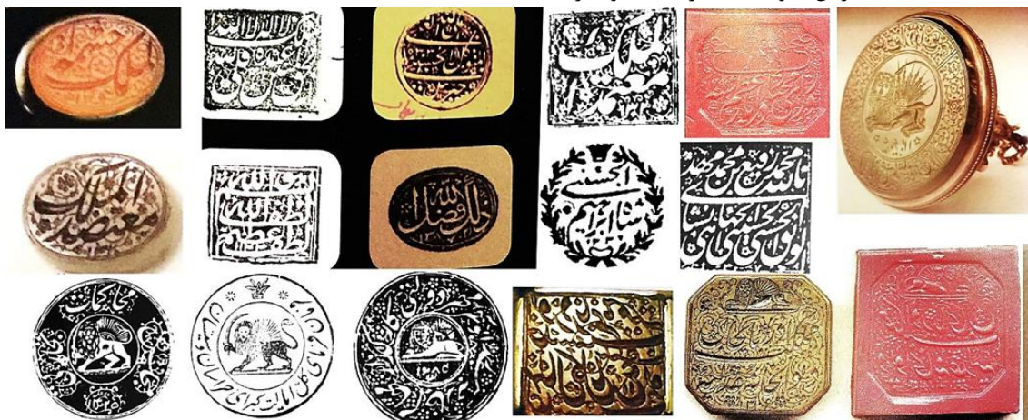
تصویر ۷- مهرهای متنوع دولتی، درباری و... (احتشامی، ۱۳۸۵: ۱۳۰-۳۴۵)

در ایران در طغریهای آغازین، فرمانها و حکمها که با آب طلا به صورت خاص با متنهایی نظیر: "حکم والا شد"، "فرمان جهان مطاع شد" و... در عهد قاجار سجع های "الملک الله تعالی"، "حکم همایون شد"، "فرمان والا شد" و... یکی از ارکان مهم اسناد به شمار می آمد. صورت دیگری از خط طغری که تا کنون موقعیت کاربردی خود را در آثار هنری مختلف حفظ کرده، نوشتن نام یا سجع های خاص به این خط است که مهمترین کاربرد آن، نقش برخی از مهرهاست (همان: ۵-۱۸۰). هنر سجع نویسی بر روی مهر: که نوعی نثر است و در آن، مصرع، ابیات، واژه های هم قافیه و مناسب و... بکار برده میشود و انتخاب آن بنا به نسب فرد، اعتقادات مذهبی، عنوان، شغل و... برای حک روی مهرها انتخاب میشود. سجع مهر پادشاهان، سند گویای سلیقه آنهاست و توجه به مضمون آنها به جزآشنایی با نام و کنیه، سلیقه و اعتقادات صاحبان آنها را نیز به خوبی آشکار میسازد که بیشتر با خط نستعلیق نوشته و با نقوش مختلف تزئین میشود است (جدی، ۱۳۸۷: ۲۳۹). رجال و شاهزادگان قاجار افزون بر مهرهای شخصی که حاوی نام یا سجعی موزون به همراه نام آنها بود، مهرهایی با القاب خاص و پسوندهای نظیر: الدوله، السلطنه، ملک، ممالک، رکن الدوله، مستشار السلطنه و... نیز داشته اند.