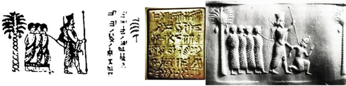
تصویر ۵: وسط: نگین انگشتی راست: مهر منسوب به اردشیر (جدی، ۱۳۹۲: ۱۰۴-۱۰۷).