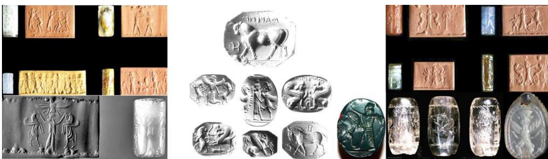
تصویر ۳: مهرهای سیلندری و استوانه ای هخامنشی (همان، ۱۱۰-۱۴۰).

اغلب در بالای سر پهلوان سلطنتی صفحه ای بالدار که از درون آن نیم تنه بیرون آمده مردی تاجدار، که اینک او را به عنوان فره شاهی میشناسیم و نه بزرگترین خدا یعنی اهورامزدا، نقش شده است. انتهای صحنه اغلب یک درخت نخل است که به احتمال زیاد، اهمیتی مذهبی داشته است. در مهرهای اولیه داریوش، تاج شاه را کنگره هایی شیبدار و در زیر آن حلقه تاج که بر روی آن نقطه های بسیار کوچکی حک شده، تشکیل میداده است. این شیوه نمایش یادآور تاج داریوش در نقش برجسته بیستون است. در اثرهای مهر بر روی لوحهای اواخر دوره پادشاهی داریوش این کنگره ها به میخ های کوچکی تبدیل و بر روی حلقه تاج بلند و پخش شده اند. مشابه آن در تاجهای داریوش، دیده میشوند. (اشمیت، ۱۳۸۹: ۹-۱۳۸).