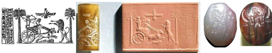
تصویر ۴: وسط (مهر با سه ردیف خط: پارسی باستان، عیلامی و بابلی "من داریوش هشتم"، چپ: مهر استوانه ای داریوش در موزه بریتانیا) <جدی، ۱۳۹۲: ۱۰۴-۸۵>.

خط جایگاه ویژه ای هم بر روی مهرها داشته که امروزه با بررسی این خطوط و نقوش تصویری همراه آن، سیر تحول فرهنگ و هنر هر قوم را ارزیابی میکنیم. به طور کلی خطهای میخی، پهلوی (قبل از اسلام) و خطهای کوفی، طغرا، تعلیق و نستعلیق (بعد از اسلام) پر کاربرد ترین خطوط در سیر تحول حکاکی خط روی مهر بوده است و علاوه بر اطلاعات شگفت انگیزی که پس از خواندن متنها و ترجمه گل نبشته های هخامنشیان در مورد وجوه زندگی در ایران باستان آشکار خواهد شد، آندسته که علاوه بر خط عیلامی در بردارنده نبشته هایی به خط آرامی نیز هست که گواه وجود فرهنگی چندزبانه در تخت جمشید است (دو مهر "پرنکه" عموی داریوش شاه، بزرگ و رئیس دیوان است که کتیبه به زبان آرامی است ولی زبان مادری صاحب مهر آرامی نیست). واژگان سبکی و شمایل نگاری هر دو مهر یادآور هنر آشور است (جدی، ۱۳۹۲: ۶۱).