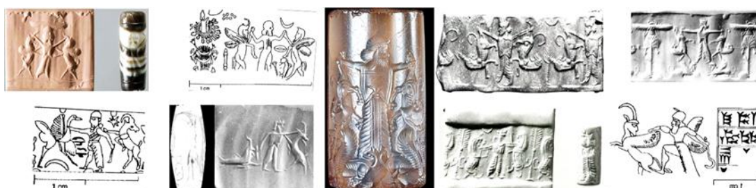
تصویر ۱- آثار متفاوت از مهرهای دوره هخامنشی با نقش شاه در موضع قدرت، گریفین، حلقه اهورامزدا و اسفنکس همراه خطوط رایج (جدی، ۱۳۹۲: ۸۸-۱۲۰).

استوانه ای نیز دخیل بوده است (کولون و پرادا، ۱۹۴۵: ۴۵-۱۳). مهمترین منبع اطلاعاتی ما درباره هنر ایران-هخامنشی، کاخ تخت جمشید است که در فاصله سالهای ۵۲۰ و ۴۶۰ قبل از میلاد بوسیله داریوش و خشایارشا-جانشینان کوروش-ساخته شد. در تخت جمشید، گاوهای ریش دار و بالدار با سرهای انسانی، بدن گاو و دو بال عقاب (لاماسو)، که تجسم ماه هستند، مانند پاسداران کاخ شاهان هخامنش اند که بر مدخل دروازه خشایارشا قرار گرفتند (صمدی، ۱۳۶۷: ۳۱). بر اساس مطالعه لوحه های مهر شده از باروی تخت جمشید این فرضیه قوت می گیرد که حاکمان هخامنشی و صاحب منصبانشان شمایل نگاری مهرهای دوره عیلام جدید را به ارث برده اند: (شکارچی سواره با تیرو کمان به سمت شکار یا پرستشگری در مقابل یک هیولا که نمادی از خدا بوده قرار گرفته است...). نقوش رایج مهرها دوره هخامنشی یافت شده: شاه، پیاده یا سوار بر ارابه تیرو کمان در دست، در حال شکار شیر یا گراز مهرها، حلقه اهورامزدا و نقوش اشاره به وقایع تاریخی مانند نبرد بین پیاده نظام ایران با پیاده های ترانس یا ردیف اسرای فینیقی و مصری دارد (که این قدرت و فتح را حتی در نقش مهر میاوردند در تعدادی نقش مهر حلقه اهورا مزدا بین دو حیوان که نماد پیام آسمانی یا بین دو دیو که خاطره ای از روش باستانی هوریان، دیده میشود. گاه تصویر شاه در حال بوئیدن گل، که قرنها بعد سلاطین عثمانی آنرا تقلید کردند (کالیکان، ۱۳۵۹: ۱۲۰).