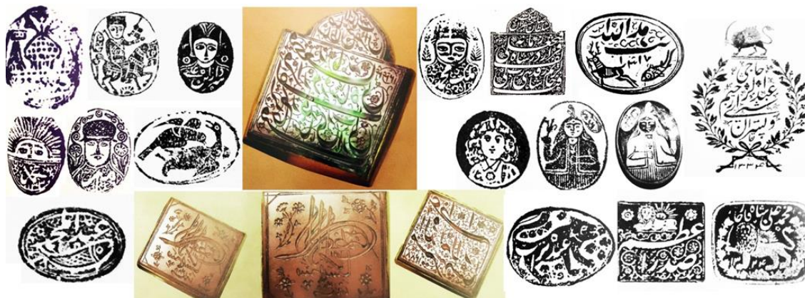
تصویر ۹- نقوش شامل حیوانات، حیوان بیشتر شیر (قدرت) همراه با عناصر طبیعی چهره انسانی در معدود مهرها تصویر زن (همان: ۵۶۰-۶۷۰).

در آنها است که تا حدودی شناسایی صاحبان آنها را ممکن میسازد: نوع کلاهها، سیلها، حالت کلی چهره ها و حتی نقوش گیاهی و جانوری به این مهرها ویژگیهای منحصر به فرد بخشیده است. این مهرها بیشتر در اختیار کسانی بوده که موقعیت اجتماعی بالایی نداشته اند که در اواخر دوره قاجار این مهرها در میان اصناف و به خصوص نظامیان رواج داشته که به دلیل تازگی و بیان خلاقه صورتها چشمگیر هستند ولی در منابع رسمی به کار نرفتند و به دلیل موقعیت اجتماعی صاحبانشان در حاشیه اسناد معتبر زده نمیشدند. خطها و تزئینات با خوشنویسی مرسوم متفاوت بوده. این مهرها بیشتر برای دریافت مواجب شش ماهه نظامی گری شان بوده که آنرا تایید و جلوی نام خود را امضا میکردند کرده. گروه دوم: مهرهایی که نقش حیوانات را دارند نقوش این مهرها تا حدودی بیانگر نوع اشتغال صاحبان آن ها به حرفه هایی است که به طریقی با حیوانات در ارتباط است. نقشهای: آهو، گوزن و دیگر حیوانات نشان دهنده شکارچی بودن صاحب آن یا تصویر ماهی حکایت از صیاد بودن مالکان مهرها هستند. با این حال رابطه ای میان نقوش حیوانات درنده مانند شیر نماد قدرت و جسارت بوده. در برخی از این نوع مهرها شکل بیرونی مهر تغییر کرده و آخرین مهری که از این گروه دیده شده نقش دو میمون دیده میشود که به نظر میرسد نشاندهنده یک صحنه شیطانی باشد که در آثار تصویری دوران باستان گاه به شکل انسان دم دار ظاهر شده است - گرچه بیان چنین مفاهیمی در دوره قاجار عجیب به نظر میرسد. احتمالاً استفاده از نقش حیوانات در آنها تا حدودی الهام گرفته از مهرها و نشان های رسمی و دولتی است که نقشی از شیر یا شیر و خورشید در ترکیب با نام آن تشکیلات دولتی بکار میرفته است - بر خود دارد. (همان: ۱۶۰-۱۲۰).