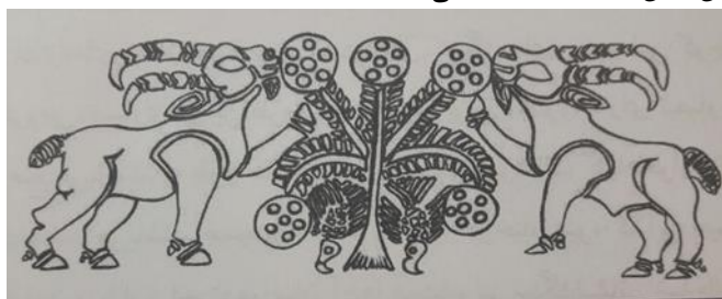
شکل ۸- نقش مایه منقور و مرصع بز و درخت با میوه انار (آقاباسی، ۱۳۸۹: ۲۲۰)

صحنه مرغزار، به صورت گیاهان، علفزار، چمنزار به صورت نقش برجسته بر روی ظروف سنگ صابونی در منطقه جیرفت، تصویر شده اند. به طور مثال، تصاویر منقور حیوانات گیاه خور مانند بز، دارای چشم سنگ نشانه می‌باشند. همچنین، تصاویر منقور درختان میوه که این حیوانات در حال چریدن، خوردن و یا استراحت در میان آن‌ها هستند، نیز سنگ نشانی شده اند و میوه این درختان مرصع است. از جمله این درختان، می‌توان درختان اناری را مثال زد که بر روی ظرف استوانه ای ساخته شده از جنس صابونی، نقر شده اند و در دو سوی آن‌ها دو بز با شاخ‌های بلند در حال خوردن میوه‌های انار آن‌ها می‌باشند. تصاویر میوه انار این درختان، مرصع می‌باشند. انار، میوه ملی ایرانیان است و همواره نزد آنان مقدس بوده است، زیرا اعتقاد داشتند که یکی از میوه‌های بهشتی بر روی زمین است. بنابراین ما شاهد تصویری هستیم که در آن بز، حیوان ملی ایرانیان در حال خوردن انار، میوه ملی ایرانیان نشان داده است. (آقاباسی، ۱۳۸۹: ۲۱۹)