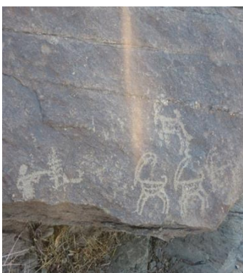
شکل ۶- شکارگاه، درخت سرو در کنار بزهای کوه (نگارندگان)