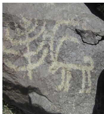
شکل ۵- درخت سرو در کنار بزکوهی (نگارندگان)