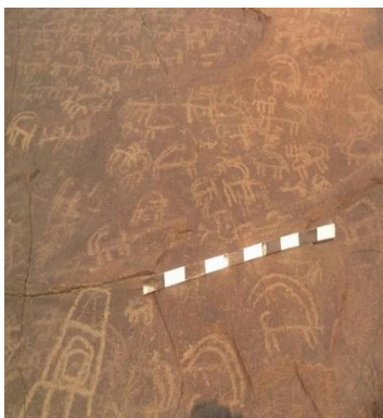
شکل ۲- مجموعه ای از بزهای کوهی