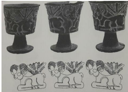
شکل ۷- تصویر بزرگی شاخ های بز (مجیدزاده، میری، ۱۳۹۲: ۱۱۷)

حیوانات نشان می دهد که تقریباً از تمام سنین در میان آن ها دیده می شود. جنسیت آن ها به صورت خیلی روشن مشخص و حتی در نشان دادن آن اغراق شده است (چرا؟ به دلیل اهمیت آن ها؟ یا به دلیل اهمیت باروری؟ یا . . .). گفته پردازان این نقش مایه ها وقتی گاوها را در حالت نشسته به تصویر کشیده اند، آن ها را در حالتی ترسیم کرده اند که گویی آزاد هستند؛ ولی، در حالت ایستاده غالباً با چیزی بسته شده اند. چیزهایی که به پاهای آن ها بسته شده به طبیعت حیوانی آن ها بستگی ندارد. سر این حیوانات (گاوها) غالباً از نیم رخ نشان داده و شاخ های آن ها از روبرو ترسیم شده است. گاهی هم این حیوانات اهلی به صورتی تصویر شده اند که گویی یال های آن ها را شانه کرده اند و بلندی یال های آن و بزرگی شاخ های آن ها به صورتی است که گفته خوان نوعی عزم و اراده را در آن ها می بیند. تصویر (مجیدزاده، میری، ۱۳۹۲: ۱۱۵)