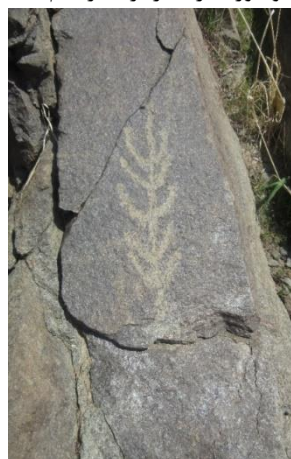
شکل ۳- درخت سرو (نگارندگان)