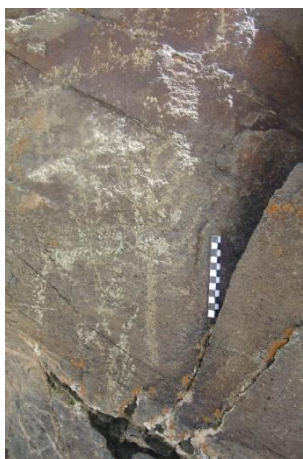
شکل ۴- دوسرو فرسایش یافته (نگارندگان)

درخت حک شده بر روی تپه شاه فیروز نقش استیلیزه سرو می باشد. این درخت هابه شکل مستقل حک شده است و در موارد اندکی در دو مورد در کنار بزها ترسیم شده اند.