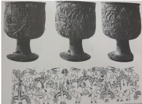
شکل ۱۲- اندازه طبیعی حیوان و درخت (مجیدزاده، میری، ۱۳۹۲: ۱۲۵)