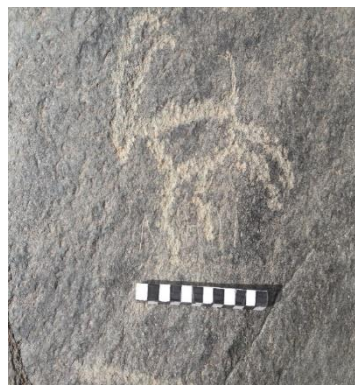
شکل ۱- بزکوهی با حالت پرش (نگارندگان)

درخت حک شده بر روی تپه شاه فیروز نقش استیلیزه سرو می باشد. این درخت هابه شکل مستقل حک شده است و در موارد اندکی در دو مورد در کنار بزها ترسیم شده اند.