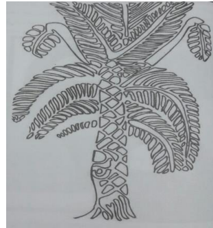
شکل ۱۱- درخت نخل و میوه اش خرما بر روی تنگ مخروطی (آقاعباسی، ۱۳۸۹: ۲۲۳)

یا این که این رابطه به صورت رابطه ای اغراق شده تصویر شده است. به نوعی که حیوانات اهلی به اندازه یک درخت به تصویر کشیده شده اند که در این صورت اهمیت بیشتری یکی از این دو عنصر را در زندگی این مردمان نشان می دهد. منطقاً، بز نمی تواند از درخت بزرگ تر باشد. اما گفته پرداز به صورتی بزها را به تصویر کشیده که از درخت ها بزرگ تر هستند. این بزرگی و کوچکی این دلالت معنایی را القا می کند: هر دو کنش گر برای این مردم بااهمیت هستند، ولی کنش گر حیوان اهلی اهمیت بیشتری دارد. وانگهی، گفته پرداز تصاویر کرکس ها را زیر پای این بزها ترسیم کرده است! شاید این درخت دلالت معنایی فرازمینی دارد! ژان دانیل فورست ۱ عقیده دارد که درون مایه درخت الهی، درون مایه ای است که در تمدن های قبل از جیرفت وجود داشته است. با خوردن این درخت حیوان به جوهر الهی دست پیدا می کند و در ادامه انسلن با خوردن شیر این حیوان یا گوشت آن به همان جوهره می رسد. (مجید زاده، میری، ۱۳۹۲: ۱۲۲ و ۱۲۵)