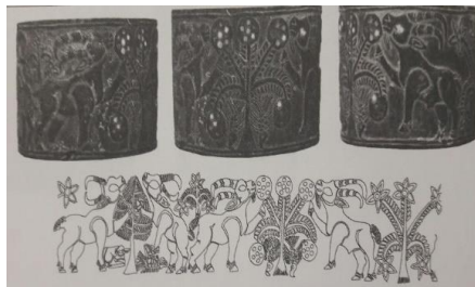
شکل ۱۳- اهمیت بزکوهی در برابر درخت، تصاویر کرکس زیر پای آن ها (مجیدزاده، میری، ۱۳۹۲: ۱۲۵)

یا این که این رابطه به صورت رابطه ای اغراق شده تصویر شده است. به نوعی که حیوانات اهلی به اندازه یک درخت به تصویر کشیده شده اند که در این صورت اهمیت بیشتری یکی از این دو عنصر را در زندگی این مردمان نشان می دهد. منطقاً، بز نمی تواند از درخت بزرگ تر باشد. اما گفته پرداز به صورتی بزها را به تصویر کشیده که از درخت ها بزرگ تر هستند. این بزرگی و کوچکی این دلالت معنایی را القا می کند: هر دو کنش گر برای این مردم بااهمیت هستند، ولی کنش گر حیوان اهلی اهمیت بیشتری دارد. وانگهی، گفته پرداز تصاویر کرکس ها را زیر پای این بزها ترسیم کرده است! شاید این درخت دلالت معنایی فرازمینی دارد! ژان دانیل فورست ۱ عقیده دارد که درون مایه درخت الهی، درون مایه ای است که در تمدن های قبل از جیرفت وجود داشته است. با خوردن این درخت حیوان به جوهر الهی دست پیدا می کند و در ادامه انسلن با خوردن شیر این حیوان یا گوشت آن به همان جوهره می رسد. (مجید زاده، میری، ۱۳۹۲: ۱۲۲ و ۱۲۵)