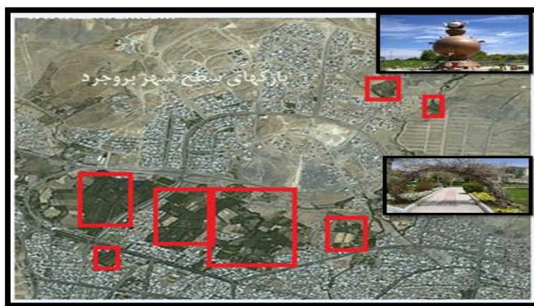
تصویر شماره ۱: پارکهای سطح شهر بروجرد