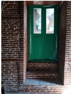
تصویر ۵: درب ورود به تالار

در این بنا سه پنجره چوبی بلند با نورگیرهایی مزین به گره چینی در طبقه اول و دو پنجره چوبی چهار لنگه ای در طبقه دوم قرار دارد که از قسمت میانی باز و بسته می‌شوند. وجود این پنجره های بلند، ضمن تأمین نور مناسب در ساعت های مختلف روز، با ایجاد سایه روشن به بافت آجری و قرمز رنگ فضای داخلی، جلوه زیبایی می بخشد. بهره گیری هنرمندانه از نور و گستردگی دید از مواردی است که در این بنا نمود یافته است. افزون بر این، تابش شعاع های نوری از خلال نورگیرهای مشبک چوبی برکالبد مادی بنا علاوه بر زیبایی، به جنبه های معنوی و قداست مکان افزوده و فضایی روحانی ایجاد کرده است. (تصویر ۴)