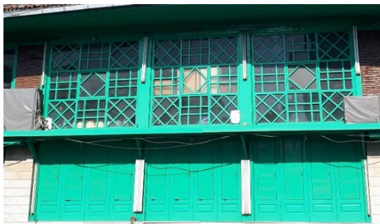
تصویر ۴: نمای بیرونی پنجره ها و نورگیر های تالار اصلی

پنجره: یکی از عناصر اصلی بنا است که بین درون و بیرون ارتباط برقرار می کند و موجب ایجاد روشنایی مناسب در فضای داخلی می شود. موقعیت و اندازه نسبی و شکل آن به فضا سازمان می دهد و به تعریف جنسیت جداره بنا چون ضخامت آن، کمک می کند. (فن مایس، ۱۳۸۴: ۱۱۲)