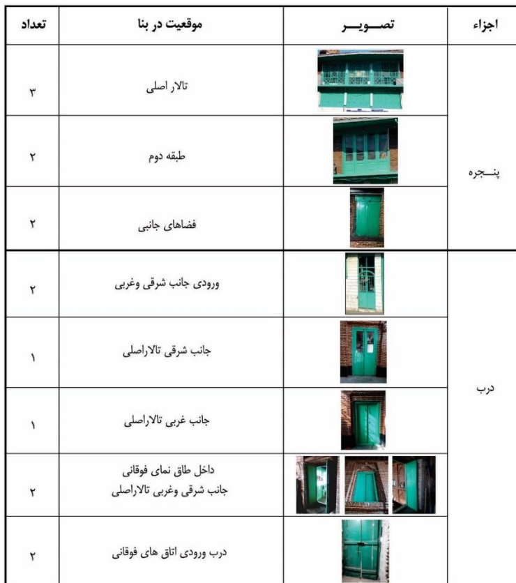
جدول ۳: بازشوهای تکیه

درب: درب، عملکردهای متنوعی چون حفظ حریم و امکان گذر از یک فضا به فضای دیگر را بر عهده دارد و در عین حال نوع رابطه فضایی را تعیین و میزان استقلال یا ارتباط آن ها را مشخص می کند. در نمای بیرونی تکیه دو درب برای ورود به داخل بنا و دو درب برای ورود به زیرزمین وجود دارد. طی بازسازی های انجام شده در سال های اخیر، درب های آهنی در ورودی بنا قرار گرفته اند. تالار اصلی دارای چهار درب چوبی است که در دو ردیف قرار دارند. درب های پایینی دسترسی به فضاهای جانبی بنا و درب های فوقانی که مربوط به طبقه دوم و مشرف به تالار اصلی می باشند، به منظور استفاده بانوان از مراسم مذهبی تعبیه شده است. (تصاویر ۵ الی ۷) جدول شماره (۳) موقعیت و تعداد بازشوهای (درب ها و پنجره ها) تکیه را نمایش می دهد.