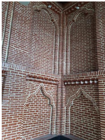
تصویر ۳: طاق نما های تالار اصلی

به طور کلی، طاق نما در معماری اسلامی علاوه بر جنبه تزئینی از نظر سازه ای نیز موجب مقاومت و استحکام بنا می شود و از رانش زمین جلوگیری می کند. (شمس، ۱۳۸۸: ۴۳) همچنین استفاده از آن مانع ضخامت غیر ضروری دیوار و در نتیجه مصرف کمتر مصالح در ساخت بنا می شود. (زمانی، ۱۳۵۲: ۳۱)