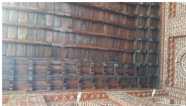
تصویر ۸: سقف تالار اصلی

چوبی با دو ردیف شبر سر است که دورتادور سقف را فرا گرفته، شبر سرها علاوه بر جنبه تزیینی، موجب استحکام سازه و انتقال بار سقف می‌شوند. (تصویر ۸) جدول شماره (۴) اجزاء تشکیل دهنده سقف را نشان می‌دهد.