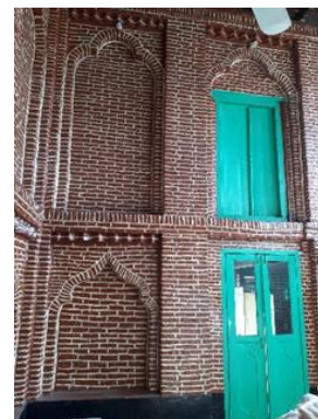
تصویر ۶: درب جانب شرقی