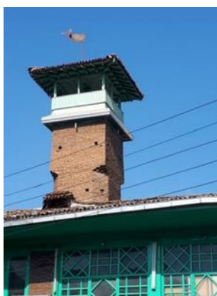
تصویر ۱۰: مناره بنا