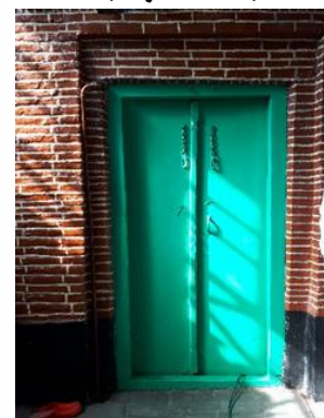
تصویر ۷: درب جانب غربی

سقف: فرم بام بنای تکیه به صورت شیب دار سفالی است و پوشش زیرین آن لمبه کوبی می‌باشد. پیش آمدگی بام، راهکاری مناسب برای سایه اندازی و نیز جلوگیری از نفوذ باران به بدنه ساختمان است. پوشش سقف در فضای داخلی تیر پوش