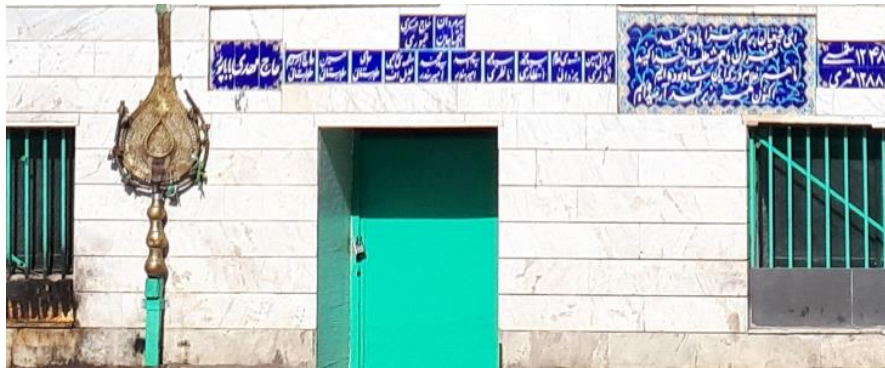
تصویر ۱۳: علم و کتیبه بنا در نمای بیرونی