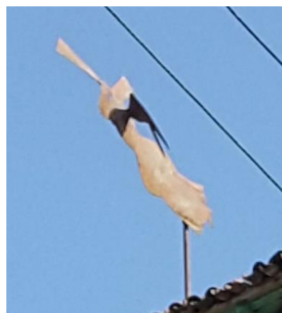
تصویر ۱۲: بادنما به شکل فرشته صورت اسرافیل

زیرزمین: در این بنا دو زیر زمین وجود دارد که در گذشته به یکدیگر راه داشتند، پس از تعمیرات صورت گرفته در ساختمان تکیه، راه ارتباطی آن ها مسدود گردید. در حال حاضر یکی از این دو فضا برای استقرار بانوان جهت شرکت در مراسم مذهبی و فضای دیگر برای انبار وسایل می باشد. در بالای درب ورودی زیرزمین، کتیبه کاشی دیده می شود که در آن اسامی بانیان تکیه، تاریخ ۱۲۴۸ شمسی و ۱۳۸۸ قمری و نیز ابیاتی نگاشته شده است و در سمت چپ آن علمی با قدمتی طولانی قرار دارد که قفل های زده شده بر روی آن دلالت بر جایگاه معنوی آن نزد اهالی و مردم منطقه دارد. (تصویر ۱۳) جدول شماره (۵) فضاهای کالبدی تکیه را نمایش می دهد.