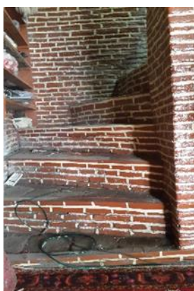
تصویر ۱۱: پله های دسترسی به مناره

مناره: مناره به معنای جای نور و روشنایی است. بنای برج مانندی که در کنار معابد و مساجد می سازند و برای روشن کردن چراغ و یا گفتن اذان از آن استفاده می کنند. ( عمید، ۲۵۳۶:۹۹۱) مناره در دوران پیش از اسلام به عنوان نشانه راه یابی و یا انجام مراسم مذهبی و آیینی به کار می رفت. این بنا در دوران اسلامی با مفاهیم دینی اسلام ترکیب گردید و با تغییر مکان و قرار گیری در کنار مسجد و مکان های مقدس به نمادی در معماری اسلامی تبدیل شد. (نادری گرزالدینی و نادریان، ۱۳۹۶) در ضلع غربی تکیه اجابن تک مناره ای وجود دارد که دسترسی به آن از داخل بنا و از طریق پلکان مارپیچ صورت می گیرد. ساقه این مناره ۸ وجهی است که به واسطه چهار گوشواره، سطح مقطع آن به مربع تبدیل شده است. تاج مناره به شکل اتافک چهارگوش نیمه باز و سقف آن شیب دار سفالی است. در پیش آمدگی های زیر سقف شیر سرهای چوبی وجود دارد. (تصاویر ۹ الی ۱۱)