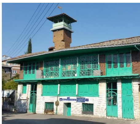
تصویر ۱: نمای بیرونی تکیه اجابین