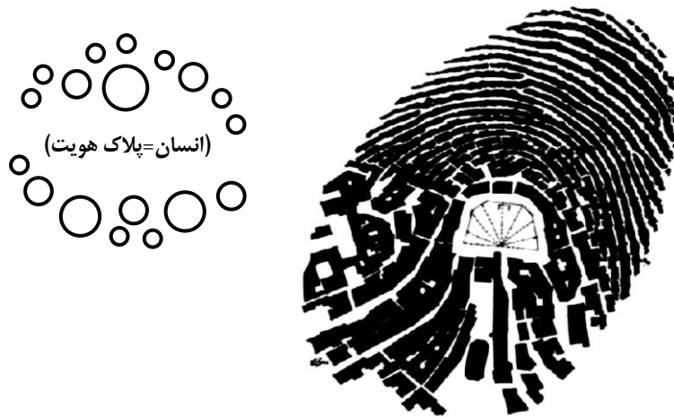
شکل ۲- پلاک هویت شهری

هویت شهری را می‌توان از چند بعد کالبدی و طبیعی، انسانی و سرمایه اجتماعی، ۱۷ تاریخی و اقتصادی بررسی نمود. هویت مکان در اثر تجربه مستقیم محیط فیزیکی و محک زدن فضا به وجود می‌آید و بازتابی از وجوه اجتماعی و فرهنگی مکان است. هویت مکان به ویژگی‌های قابل تشخیص مکان اشاره دارد درحالی‌که هویت مکانی احساسی در یک فرد و یا جمع است که به واسطه ارتباط با یک مکان برانگیخته و باعث افزایش انرژی در افراد می‌شود (رضازاده، ۱۳۸۰: ۲۷-۲۳). هویت شهری بخشی از زیرساخت هویت انسان و حاصل از شناخت‌های انسان‌ها در زندگی برخوردار بوده است. عوامل و عناصر هویت بخش یک شهر بسیار گسترده و حائز اهمیت هست هویت شهر بر پایه مؤلفه‌های تشکیل‌دهنده اجزاء و شکل‌دهنده فضا می‌باشد، که عبارت‌انداز: مؤلفه‌های طبیعی، مصنوعی و انسانی که هر کدام صفات و متغیرهای ویژه خود را داراست. که با به‌هم‌پیوستن این اجزاء پلاک هویت شهری را می‌توان به وجود آورد طبق (شکل ۲)، نشانه این موضوع می‌باشد.