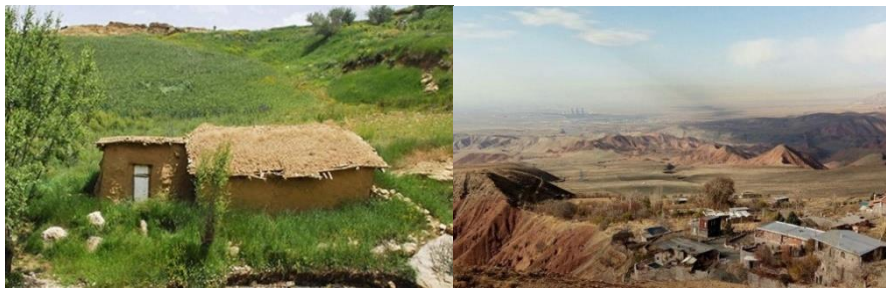
عکس ۴: روستای شاه کوه

دو امامزاده هم در این روستا قرار دارد به نام‌های امامزاده یوسف و حسین که از نوادگان امام موسی بن جعفر می‌باشند. این آرامگاه بسیار ساده، اتاقی کوچک بوده و با خشت و گل و سقفی چوبی ساخته شده است. ( www.parsine.com )