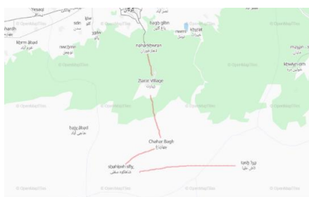
نقشه ۳- روستاهای مسیر گردشگری

قره سو، اترک و گرگانرود از رودهای پرآب استان محسوب می شوند و پیرگردکوه بلندترین کوه استان بوده و کوههای گلدین، شاهکوه، زریوان و خواجه قنبر از دیگر کوههای مهم استان بشمار می روند. این استان طبق شواهد موجود از بیشترین جاذبه‌های توریستی در بخش‌های طبیعی، جنگلی و اکوتوریستی برخوردار بوده و از این لحاظ می‌تواند قطب اکوتوریسم شمال باشد. یکی از زیباترین جلوه‌های اکوتوریستی استان گلستان، همچون سایر نواحی شمالی ایران، وجود روستاهای زیبا به ویژه در دل جنگل‌های بکر و شگرف آن است که بر مبنای حفاظت از محیطزیست و جذب حداکثر گردشگر، روستاهای موجود در مسیر کوهنوردی از نهارخوران گرگان به سمت جنوب شناسایی شدند. این منطقه به طول ۴۵ کیلومتر از روستای زیارت در جنوب گرگان شروع و پس از عبور از روستاهای چهارباغ، شاه کوه و تاش علیا به تاش سفلی ختم می‌شود. زیارت، چهارباغ و شاه کوه در استان گلستان و تاش علیا و تاش سفلی در استان سمنان واقع شده اند که در زیر به بررسی برخی از ویژگی های آن‌ها پرداخته می‌شود: