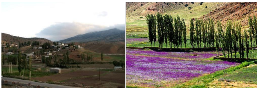
عکس ۳: روستای چهارباغ