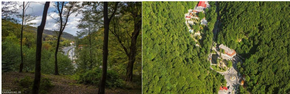
عکس ۱: ناهارخوران گرگان