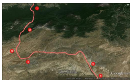
نقشه ۲- عکس هوایی روستاهای مسیر گردشگری