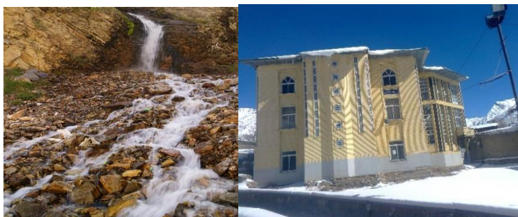
عکس ۵: روستای تاش

۴-معدن مواد پودر شوینده (www.tash92.blogfa.com)