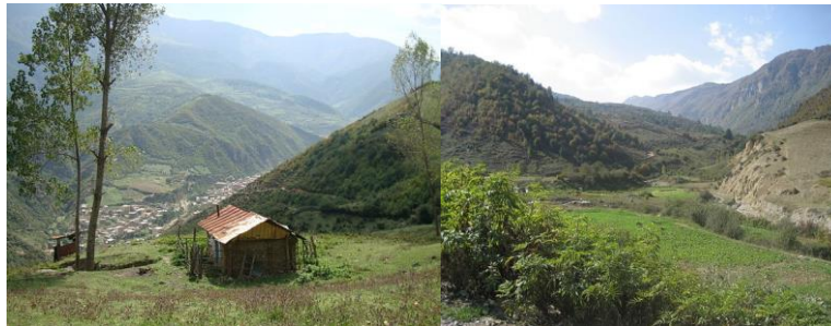
عکس ۲: روستای زیارت

در اطراف جاده منتهی به امامزاده مغازه هایی هستند که به نوعی مرکز خرید روستا برای مسافران را شکل می دهند. صنایع دستی ساکنان محلی، میوه های جنگلی و محصولات دامی محلی از جمله محصولاتی هستند که می توان در این مغازه ها یافت. کافه ها و رستوران ها و سفره خانه نیز در نزدیکی روستا قرار دارند و هتلی هم برای اقامت مسافران ساخته شده است (www.karnaval.ir).