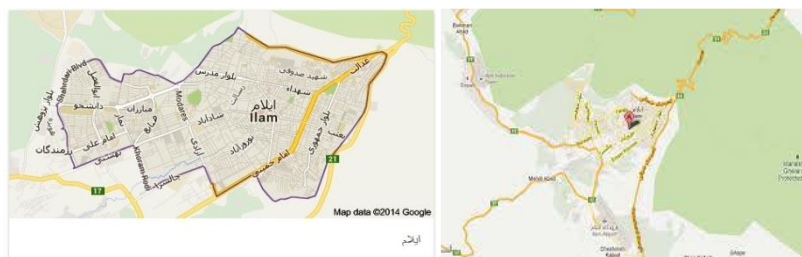
تصویر(۱) - نقشه موقعیت شهر ایلام.

شهر ایلام از نظر موقعیت جغرافیایی در ۴۶ درجه و ۲۸ دقیقه طول شرقی و ۳۳ درجه و ۳۸ دقیقه عرض شمالی قرار دارد و از نظر موقعیت محلی در مغرب ایران قرار دارد. این شهر در دره کوهستانی و در شمال شرقی دشتی به مساحت تقریبی ۲۵ کیلومتر مربع در دامنه جنوبی کبیرکوه از سلسله جبال زاگرس واقع شده است. وسعت شهر با محدوده تعریف شده طرح جامع می باشد. ارتفاع متوسط آن از سطح دریا حدود ۱۴۴۰ متر می باشد. شهر ایلام مرکز استان ایلام است که در حصار از کوه ها و ارتفاعات جنگلی استقرار یافته و آب و هوای معتدل کوهستانی دارد( صالحی و همکاران، ۱۳۹۶: ۱۰۷). این شهر بر پایه سرشماری ۱۳۹۵ خورشیدی برابر با ۱۹۴۰۳۰ نفر بوده است. شهر ایلام به ۴ منطقه، ۱۴ ناحیه و ۳۸ محله شهری تقسیم شده است. تصویر(۱): موقعیت شهر ایلام را نشان می دهد.