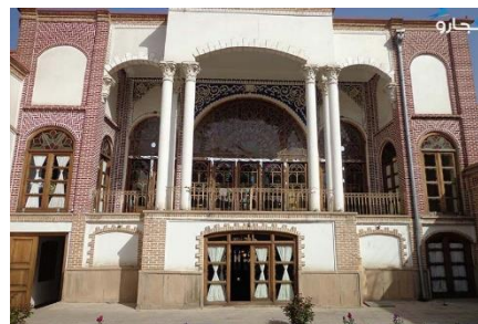
شکل ۱۰- خانه حیدرزاده