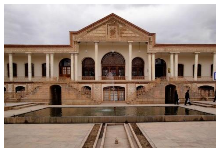
شکل ۸ - خانه امیرنظام گروسی