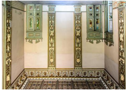
شکل ۷- خانه مستوفی الممالک

خانه مستوفی الممالک یکی از دست نخورده ترین خانه‌های تاریخی تهران است که در محله تاریخی سنگلج تهران واقع شده است. خانه مستوفی در دوره ناصری در سال ۱۱۰۳ ه ق (هزار و دویست و هفتاد و دو هجری شمسی) ساخته شده است. ورودی اصلی ساختمان در ضلع شمال شرقی مجموعه قرار داشته که دارای درب دو لنگه چوبی بزرگ و سر در قوس دار است و میدانی بزرگ هم در جلوی آن قرار داشته است. در قسمت ایوان‌ها در ایوان جنوبی در سطح زیرزمین از ستون های سنگی استفاده شده و در طبقه اول از ستون های چوبی اندود شده است (آرشیو میراث فرهنگی تهران، ۱۳۸۸).