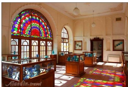
شکل ۹- خانه امیرنظام گروسی