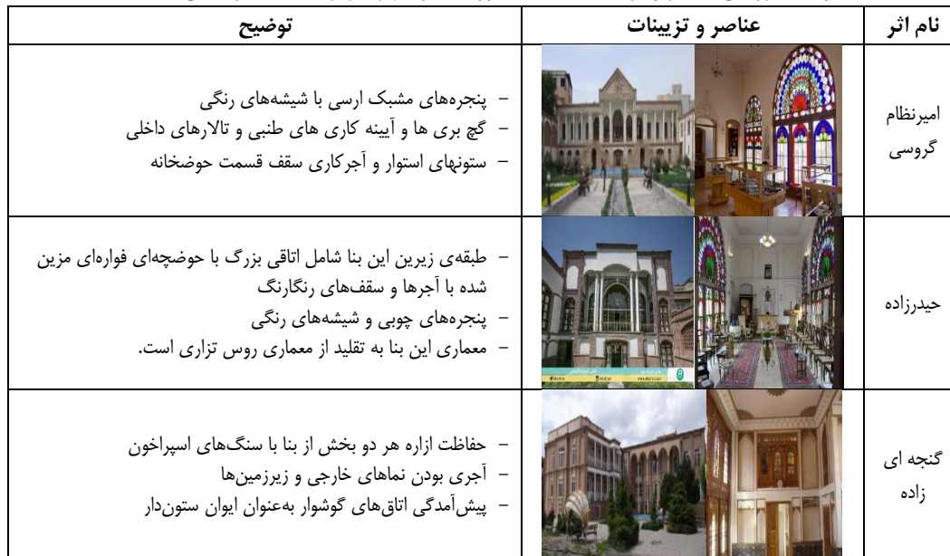
جدول ۳. بررسی عناصر و تزئینات خانه‌های دوره قاجار شهر تبریز (ماخذ: نگارندگان، ۱۳۹۹)