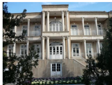
شکل ۱۲- خانه گنجه ای زاده