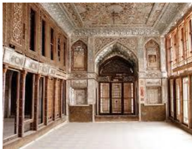
شکل ۵- خانه امام جمعه

این بنای تاریخی در خیابان ناصر خسرو، کوچه امام جمعه شماره ۳۷ قرار گرفته است. قدمت این بنا به دوره قاجاریه و به ۱۲۸۰ ه.ق می‌رسد و در تاریخ ۷۵/۸/۲۶ به ماده ۱۷۷۲ در فهرست آثار ملی ثبت گردید (میراث فرهنگی تهران، ۱۳۸۸). این بنا دارای بخش اندرونی و بیرونی است. طبقه اول شمال بخشهای، تالار تابستانی، حوض خانه، توالی و دستشویی، ایوان شمالی جنوبی و پله‌های دسترسی به طبقه دوم، دو اتاق گشواره و یک پستو یا انباری، گشواره‌ها که در دو طرف حوض خانه با آجر مفروش شده است. طبقه دوم دارای ایوان، تالار تابستانی، تالار زمستانی و اتاقهای خصوصی میباشد. ایوان ستوندار با سر ستونهای گچبری و مقرن، دارای کف آجری میباشد. معماری ستونها در کلیه دوره‌های یاد شد در غرب برقواعد (تناسبها) تقارن و تکراری معین استوار بود (آرشیو میراث فرهنگی تهران، ۱۳۸۸).