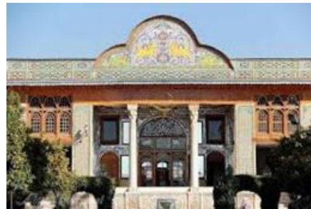
شکل ۲- خانه وثوق الدوله