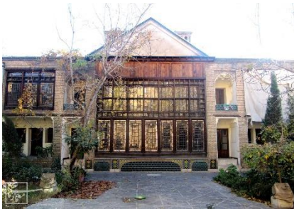
شکل ۳- خانه وثوق الدوله