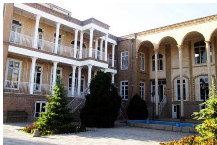
شکل ۱۳- خانه گنجه ای زاده

این خانه تلفیقی است از معماری دوره قاجار و معماری دوره پهلوی اول در محله تاریخی مقصودیه، روبروی دانشکده معماری واقع شده است. این اثر در ۸ مرداد ۱۳۸۱ با شماره ثبتی ۶۰۲۱ به عنوان آثار ملی ایران ثبت شده است. خانه ۴۰۰۰ مترمربع و در زیربنایی ۷۳۰ مترمربعی ساخته شده است. خانه گنجه ای زاده از نظر دوره شناسی به دو دوره تاریخی تقسیم می گردد و مطالعات میدانی و ثبتی بنا نشان می دهد که کالبد کهن این خانه بخش شرقی آن است که مربوط به اوایل دوره قاجار بوده و کالبد الحاقی جانب غربی آن متعلق به اوایل دوره پهلوی است. قسمت شرقی به شکل درو نگرا و بخش غربی برو نگرا است. آجر مصالح اصلی نما است و از عناصر معماری نئوکلاسیک مانند سنتوری و سرستون های کرننتین در جبهه غربی استفاده شده است (سلطان زاده و همکاران، ۱۳۹۸).