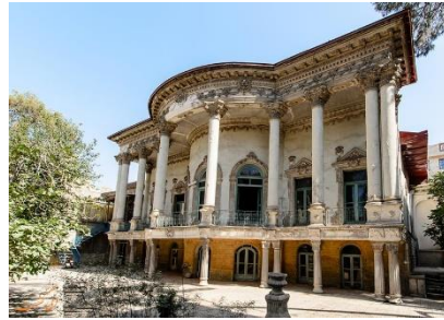
شکل ۶- خانه مستوفی الممالک