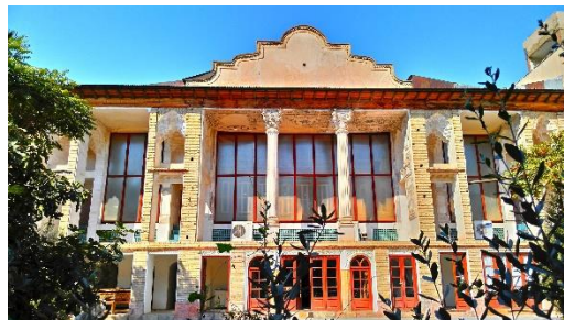
شکل ۴- خانه امام جمعه