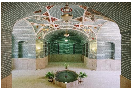
شکل ۱۱- خانه حیدرزاده

عمارت تاریخی واقع در منطقه مقصودیه شهر تبریز است که در سمت جنوب ساختمان شهرداری تبریز قرار دارد. طبق تحقیقات صورت گرفته این خانه در حدود سال ۱۸۷۰ م توسط حاجی حبیب لک ساخته شده است. این خانه در سال ۱۳۷۸ در فهرست میراث ملی ایران با شماره ۲۵۲۴ به ثبت رسیده است. این خانه به متراژ ۹۰۰ متر و دارای دو طبقه می باشد. این خانه دو حیاط اندرونی و بیرونی دارد که به وسیله خانه از یکدیگر جدا شده اند. مجموعه دارای راه پله مرکزی است که دسترسی به حوضخانه، طنبی و اتاق های جانبی و نشیمن را میسر می سازد. زیر زمین با انواع طاق پوشیده شده ولی سقف اتاق های فوقانی مسطح است (آرشیو میراث فرهنگی آذربایجان شرقی).