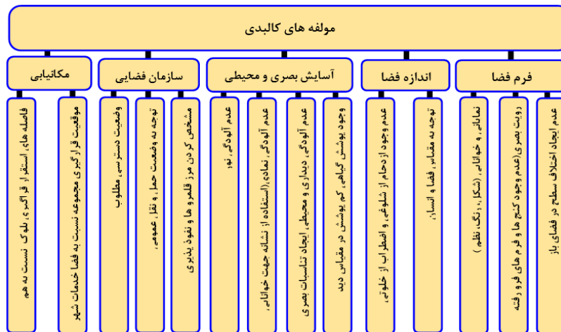
نمودار ۲- معیارهای کالبدی موثر بر ایجاد امنیت در فضای باز مجتمع های مسکونی

بازرسی های صورت گرفته در روند مبانی نظری می توان به دسته بندی مؤلفه های کالبدی موثر بر ایجاد امنیت در فضاهای باز مجتمع های مسکونی در نمودار ۲ اشاره نمود.