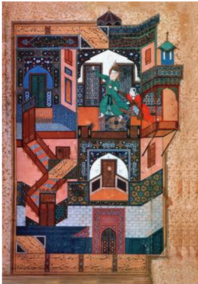
شکل ۱- فرار یوسف از دست زلیخا، بوستان