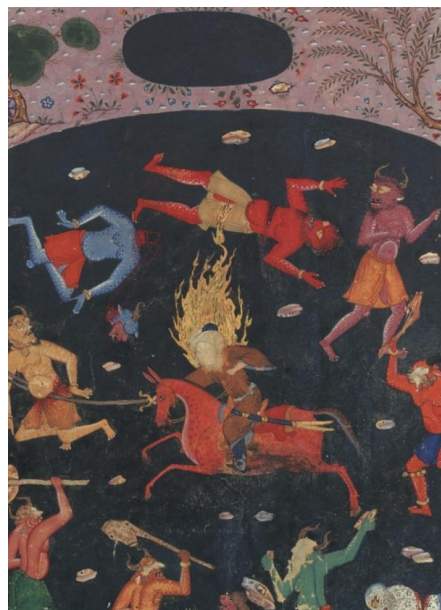
تصویر ۴. مسخر نمودن اجنه توسط امیرالمومنین علی (ع). هنرمند نامعلوم. احسن‌الکبار. ۹۸۸ ه.ق. کاخ گلستان. (رجبی، ۱۳۹۰: ۲۲۰) حبیب‌السیر، تألیف ارزشمنند خواند میر، در ذکر احوال انبیا (ع) و بیان حالات حکما نوشته شده است. جزء چهارم در ذکر وقایع ایام خلافت حضرت علی (ع) است. (شاهکارهای نگارگری ایران، ۱۳۹۰: ۱۷۹)