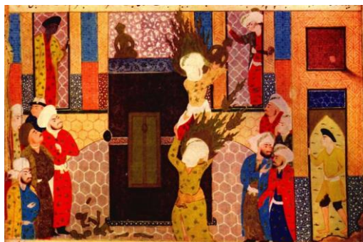
تصویر ۶. علی بر شانه‌های پیامبرت‌ها را از قسمت بالای کعبه می‌اندازد. میرخواند. روضه‌الصفاء. مصر. موزه قاهره. (شایسته‌فر، ۱۳۸۴: ص ۱۵۴)

کتاب روضه‌الصفاء اثر مولانا حسین کمال‌الدین حسین بن علی معروف به واعظ کاشفی نویسنده و واعظ فارسی است که به دستور و درخواست شاهزاده مرشد‌الدین عبدالله ملقب به سید میرزاداماد سلطان حسین بایقرا در سال (۹۰۸-۹۰۹) نوشته شده است. این اثر زندگی نام‌های شهادتی چون علی (ع) و خاندانش به ویژه امام حسین است که در مکتب باشکوه بغداد به وجود آمده است. این کتاب بین شیعیان معروف و شناخته شده است و به عنوان یادبودی از محرم استفاده می‌شود؛ همچنین اثری ماندگار از خود در مراسم عزاداری که روضه خوانده می‌شود به جا گذاشته است. (شایسته‌فر، ۱۳۸۸: ۱۸)