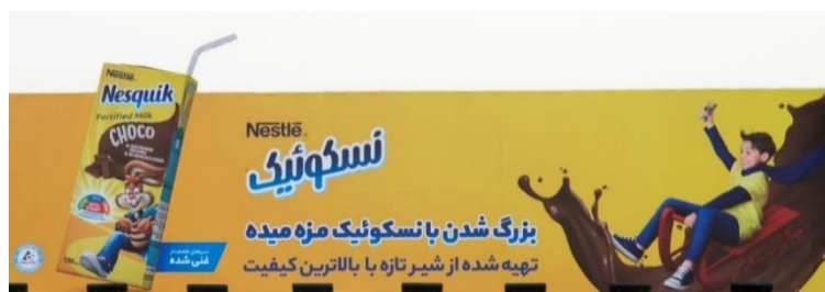
شکل ۱۰- بیلپورد شماره دو