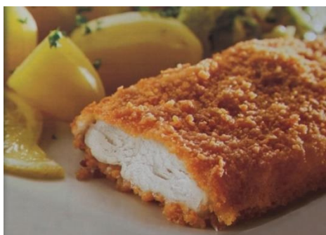
شکل ۱۲- بیلپورد شماره سه