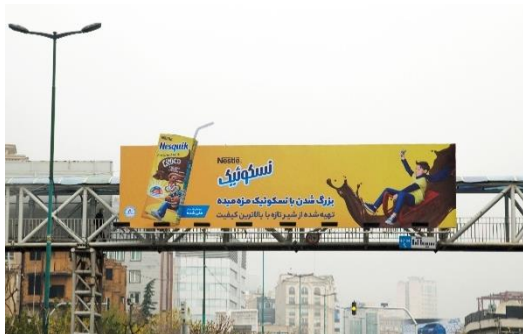
شکل ۷- بیلپورد شماره دو

شاخصه رنگی: رنگ غالب: زرد_ نارنجی / رنگ ثانویه: آبی