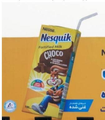
شکل ۹- بیلپورد شماره دو