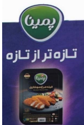
شکل ۱۳- بیلپورد شماره سه