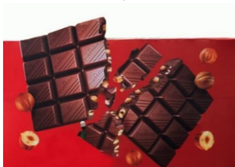
شکل ۴- بیلبورد شماره یک

شاخصه رنگی: رنگ غالب: قرمز / رنگ ثانویه: سفید