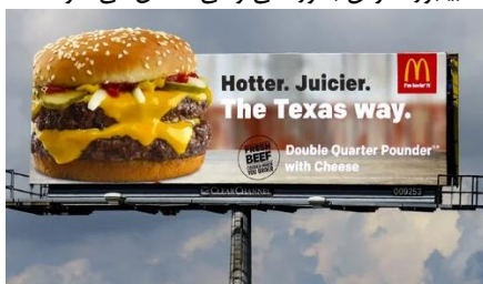
شکل ۲- نمونه بیلبورد (مأخذ: pinterest.com، ۱۴۰۰)

واژه بیلبورد به معانی مختلفی آمده که در زیر بیان می گردد و مرکب از دو بخش Bill و Board است. Bill تیزر انتهای لنگر، لایحه قانونی، قبض، صورت حساب، اسکناس، شمشیر پیاده نظام، آگهی کردن، قولنامه کردن را معنی می دهد و Board نیز به معانی تخته، تخته یا مقوا یا هر چیز مربع یا مستطیلی، صحنه تئاتر یا نمایشگاه، کف انبار پشم، میز، غذای روی میز، میز شورا یا دادگاه، مقوای جلد کتاب، حاشیه یا لبه هر چیز، کناره یا لبه کشتی، سپر، تخته بندی کردن، تابلو و... است. واژه Bill Board برآمدگی روی کشتی که لنگر روی آن قرار می گیرد؛ تخته اعلانات و آگهی ها، هر قسمت از نرده و دیوار که روی آن اعلان یا آگهی نصب می شود را معنی می شود (محقق امینی، ۱۳۹۰، ۶۴). در واقع بیلبوردها سطوح بزرگی اند که در ارتفاع خاصی نصب می شوند و کارایی آن ها به گونه ای است تا ناظر بتواند با سرعت زیاد و فاصله ی دور، اطلاعات روی آن را به راحتی بخواند و پیام تصویری آن را درک کند (ایلوخانی، ۱۳۸۸: ۶۵). کارایی یک بیلبورد موفق بطور کلی وقتی حاصل می شود که: