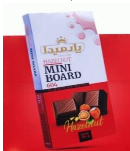
شکل ۵- بیلبورد شماره یک