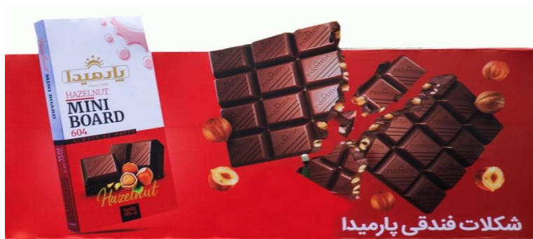
شکل ۶- بیلپورد شماره یک