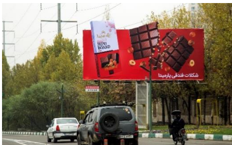
شکل ۳- بیلبورد شماره یک

توصیف اثر: بیلبورد مذکور، تبلیغ مواد غذایی شکلات فندقی پارمیدا است که طراح آن کانون ایران نوین و محل نصب آن در بزرگراه حکیم و قطع آن ۳ در ۵ متر می باشد. تحلیل اثر: