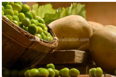
شکل ۱- نمونه عکس تبلیغاتی

عکاسی غذا و نوشیدنی ها یکی از جنبه های پر چالش تر کار عکاس طبیعت بی جان است. عکاس به مقدار زیادی شگردهای کوچک نیاز دارد اما همواره باید مراقب قواعد واقعیت در تبلیغات باشد. در صورتی که با شما قرارداد بسته می‌شود که از سوپ، بستنی یا کیک زنیک عکس بگیرید، می‌توانید برای اشتها آور نشان دادن محصول هر کاری که بخواهید انجام دهید. می‌توانید به سوپ سنگ مرمر اضافه کنید تا سبزی‌ها در سطح آن شناور شوند یا به همبرگر اسید اضافه کنید تا بخار از آن بلند شود، اما در صورتی که از برگه‌های مک دونالد عکاسی می‌کنید نمی‌توانید آنها را اندکی تغییر بدهید. در این صورت سبزی‌ها نباید در سطح شناور شوند، باید در ته ظرف سوپ باقی بمانند و بخار برگر باید ناشی از گرمای واقعی باشد. بنابراین در صورتی که نمایش زنیک تهیه کنید، واقعا می‌توانید خیلی مایه بگذارید؛ اما اگر عکس به محصول خاصی مربوط باشد قانوناً مسئولید که واقعیت را مصور کنید. هنگام عکس گرفتن از غذا به کمک یک طراح یا آشپز خوب خانگی نیاز دارید. او معمولاً ملزومات را جمع‌آوری می‌کند و طراحی غذا بر روی ظرف‌ها را انجام می‌دهد. لازم است طراحی پیدا کنید که با شما هم فکر باشد. نورپردازی غذا مستلزم مقدار زیادی دوراندیشی است. وقتی موادی مثل گوشت مرغ یا گاو سر و کار دارید، این کار به سادگی عکاسی یک تکه کروم با اندکی نور پرکننده نیست.