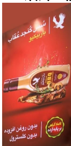
شکل ۱۷- بیلبورد شماره چهار