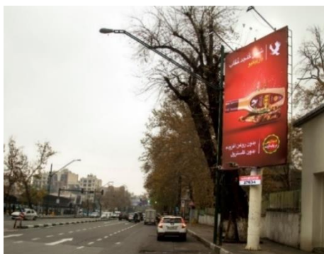
شکل ۱۵- بیلبورد شماره چهار (مأخذ: نگارنده، ۱۳۹۹)

الف- عکس تبلیغاتی سس: در این بیلبورد از تکنیک فتومونتاژ بطری سس با استیک، قارچ و سبزیجات استفاده شده است. در این فتومونتاژ به گونه ای اغراق نیز دیده می شود، بطری سس بزرگتر از غذا هست و گویی به مخاطب این گونه القاء می شود که سس حرف اول را می زند و حتی بسیار خوشمزه تر از اصل غذا است. شاخصه رنگی: رنگ غالب: قرمز / رنگ ثانویه: شکلاتی