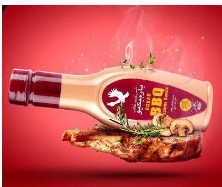
شکل ۱۶- بیلبورد شماره چهار