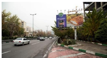
شکل ۱۱- بیلپورد شماره سه

شاخصه رنگی: رنگ غالب: بنفش / رنگ ثانویه: سبز