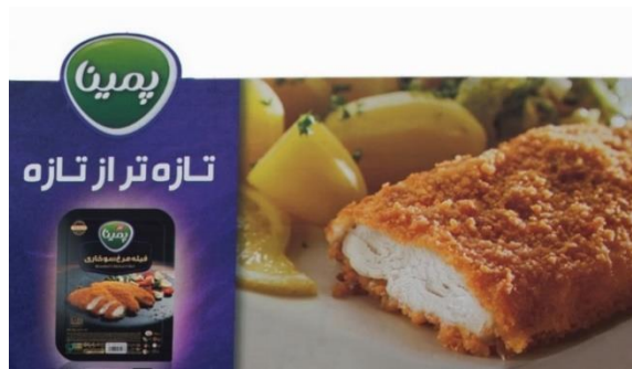
شکل ۱۴- بیلبورد شماره سه