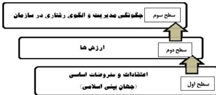
شکل ۱. لایه‌ها یا سطوح فرهنگ سازمانی و ارتباط بین آن‌ها، زارعی متین، مکتب اسلام ۱۳۸۰ ص ۶۴

بر این اساس، ارزش‌ها از اعتقادات و باورهای اساسی سرچشمه می‌گیرد و در الگوهای رفتاری در سازمان تأثیر می‌گذارد. اعتقادات و باورهای اساسی جزء مفروضات به شمار می‌آید که در هر جامعه‌ای ثابت در نظر گرفته می‌شود و اندازه‌گیری آن بسیار دشوار می‌باشد (کاووسی و قیومی، ۱۳۸۱، ص ۲۵). در این مفروضات، که اعتقادات و باورهای اساسی را دربرمی‌گیرد، باید به مبانی اعتقادی که همان جهان بینی است پرداخته شود. مفروضات بنیادین فرهنگ سازمانی اسلامی برخاسته از جهان بینی توحیدی است. از این رو، جهان بینی اسلامی و توحیدی محور بحث این پژوهش قرار می‌گیرد. در فرهنگ مبتنی بر جهان بینی و ایدئولوژی اسلامی، خداوند مبدأ و منشأ جهان هستی، و مالک، مدبر و رب حقیقی همه موجودات عالم است. در این فرهنگ انسان موجودی آگاه، عاقل و مختار، با آزادی خدامحورانه، در نظر گرفته شده است که با نگاه به پیشینیان، عبرت از گذشته، علم، عمل صالح، توجه به فناپذیری دنیا و امید به آینده - که افق اعلی قرب الهی است - به تلاش و تولید، و تعامل با جهان در موقعیت کانونی عبدالله بودن می‌پردازد.