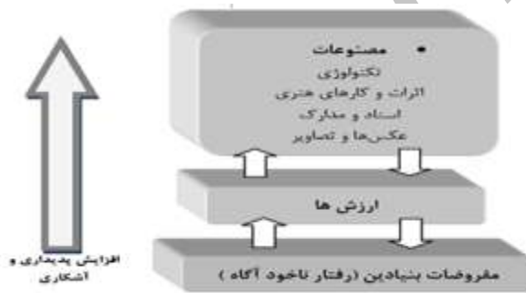
شکل (۳) مدل لایه‌های فرهنگی شاین (شاین، ۲۰۰۹، ص ۲۳).

اهمیت مفروضات بنیادین بدان حد است که فرهنگ سازمانی را مجموعه‌ای از فرضیات اساسی تعریف نمودند که افراد سازمان در روبرو شدن با مسائل، برای انطباق با محیط خارجی و دستیابی به انسجام داخلی ایجاد می‌کنند و توسعه می‌دهند. تجربه نشان داده است که این فرضیات اساسی، مفید و با ارزش بوده است و در نتیجه به عنوان روش صحیح تفکر، ادراک و احساس به اعضای جدید منتقل می‌شود (طوسی، ۱۳۷۳، ص ۱۵۴). سطوح فرهنگ سازمانی در الگوی شاین به این صورت است: