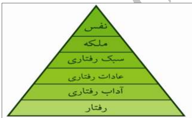
نمودار ۱: تبیین رفتار با توجه به زیرساخت‌های آن

بیان علامه می‌توان به دست آورد که توجه به آن‌ها در برنامه‌ریزی تربیتی ضروری است. هر یک از این نکات را می‌توان به‌طور مفصل و مستقل مورد بحث و مذاقه قرار داد. از آنجا که مجال طرح مفصل آن‌ها در این نوشتار نیست، به‌طور خلاصه به مهم‌ترین آن‌ها اشاره می‌شود: ۴-۱. پیام تربیتی این آیه با طرح مفهوم شاکله توجه به زیرساخت و مبنای رفتار است و نه صرف رفتار. این امر ما را از ساده‌اندیشی در تبیین رفتار و برنامه‌ریزی سطحی تربیتی باز می‌دارد. آیه با معرفی شاکله به‌مثابه علت رفتار و عامل ضلالت و هدایت در صدد تبیین رفتار آدمی است. در این آیه به ضرورت توجه به این امر درونی‌تر که رفتار را پیش‌بینی‌پذیر می‌کند و فعالیت تربیتی از طریق شناخت و اصلاح آن اثربخش می‌شود تأکید شده است. با این رویکرد می‌توان این الگو را که مفصل‌تر است برای تبیین رفتار ترسیم کرد: