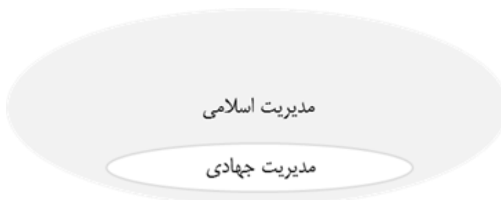
شکل ۱: ارتباط مدیریت اسلامی و مدیریت جهادی (اصلی‌پور، ۱۳۹۵، ص ۵۳)

روستاها و صدها موفقیت علمی و عملی دیگر در سطح کشور همه بیانگر کارآمدی مدیریت جهادی در عرصه‌های سنگین و پیچیده است» (عظیمی و حادق، ۱۳۸۸). در ارتباط مدیریت جهادی و مدیریت اسلامی «حالت منطقی عموم و خصوص مطلق برگزیده می‌شود؛ چراکه جهاد به‌عنوان وجه تمایز مدیریت جهادی از سایر نظریات مدیریتی، یکی از فروع ده‌گانه دین اسلام شناخته می‌شود» (اصلی‌پور، ۱۳۹۵، ص ۵۴). مدیریت جهادی در گستره قاعده جهاد فی سبیل‌الله متفاوت از سایر سبک‌ها و رویکردهای مدیریتی بروز و ظهور می‌یابد. خداوند متعال می‌فرماید: «کسانی که برای ما مجاهده نمودند، بی‌تردید آنان را به راه‌های خود، راهنمایی می‌کنیم». مطابق این آیه قاعده جهاد فی سبیل‌الله از جنس «رحیمیت» خداوند (محبت خاص خدا) است. براساس این قاعده، خدای متعال تأکید می‌کند آن‌هایی که در راه ما جهاد (نه سعی) می‌کنند، ما حتماً آن‌ها را به راه‌هایی از سوی خود هدایت خواهیم کرد. این راه‌های خدایی، به‌هیچ‌وجه برای دشمن و بلکه غیر مجاهدان از مؤمنان قابل دسترس نیست (احمدیان، ۱۳۹۳، ص ۱۴۳).