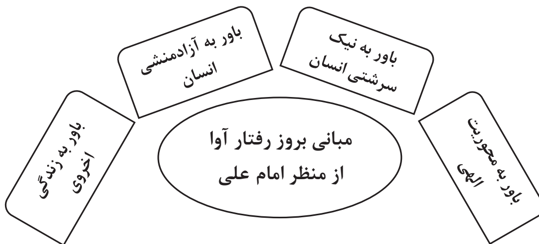
نمودار ۱. مبانی رفتار آوایی در نگرش علوی

مبانی رفتار آوایی به‌معنای مفروضات بنیادینی است که بروز رفتار آوا، تحت تأثیر آن قرار دارد. اینک مهم‌ترین باورهایی که در بروز رفتار آوایی اثرگذار است، براساس واکاوی گزاره‌های نهج‌البلاغه به شرح ذیل (نمودار ۱) دسته‌بندی می‌شود: