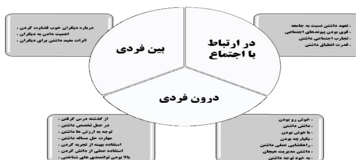
نمودار ۳. ویژگی‌های انسان خردمند در دستاوردهای روان‌شناسی

در نمودار ۳، تبیین ویژگی‌های انسان خردمند در دستاوردهای روان‌شناسی آمده است.