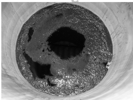
شکل ۴- رسوب ته‌نشین شده در کف مخزن ته‌نشینی

جهت جداسازی رسوب (لجن) از مایع شناور روی آن می‌توان از یکی از روش‌های صنعتی سانتریفوژ کردن، صاف کردن، ته‌نشینی و دیگر روش‌ها استفاده کرد. در عملیات مطابق با این مقاله از تکنیک ته‌نشینی که یک روش تقریباً ساده است برای جداسازی لجن از مایع شناور استفاده گردید. در این خصوص رسوب ته‌نشین شده در کف مخزن در شکل (۴) نشان داده شده است