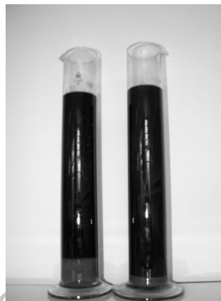
شکل ۳- رسوب‌گیری از ملاس تخمیر شده در حالت منتخب

لذا بر اساس نتایج به‌دست آمده از جدول‌های (۳) و (۴) نسبت غلظتی ۲۵:۷۵ ملاس به اتانول و pH نهایی محلول‌ها در محدوده ۱۰ تا ۱۰/۵ به‌عنوان شرایط بهینه برای انجام این فرایند در مقیاس نیمه صنعتی انتخاب گردید. شکل (۳) رسوب‌گیری از محلول را در حالت منتخب نشان می‌دهد.