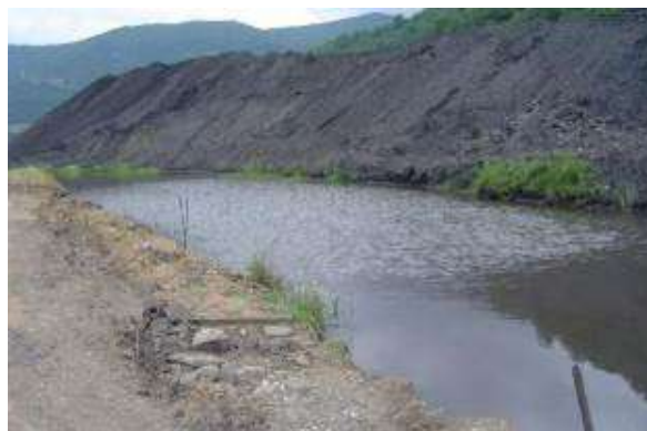
شکل ۲: نمایی از سد باطله و استخر آبیگری باطله کارخانه زغالشویی زیراب

روش استخراج زغال‌سنگ در معدن گلیران، با توجه به موقعیت لایه‌های زغال‌سنگ و نحوه دسترسی به آن‌ها، با احداث تونل به صورت زیرزمینی است. این نوع استخراج، مزایایی همچون هزینه معدن کاری پایین، راندمان تولید بالا و نیاز به نیروی کار کم داشته که البته با معایبی همچون هزینه سرمایه گذاری بالا و احتمال نشت وسیع همراه بوده است. فرآیند زغالشویی در محل معدن انجام نمی‌شود و زغال‌سنگ‌ها برای این فرآیند به کارخانه زغالشویی زیراب منتقل می‌شوند که در