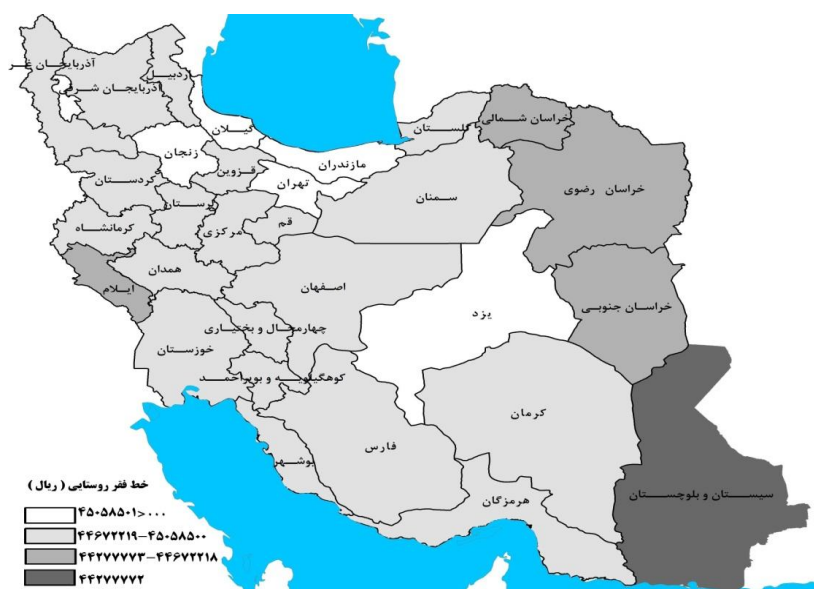
شکل 3- نقشه جغرافیایی خط فقر کشور در سال 1390

شکل 3، وضعیت خط فقر در مناطق روستایی استان‌های کشور را برای سال 1390 نشان می‌دهد. همان‌گونه که مشاهده می‌شود، خط فقر در روستاهای استان سیستان و بلوچستان کمترین مقدار و در روستاهای استان‌های تهران، گیلان، مازندران، زنجان، یزد و قم بیشترین مقدار را دارد.