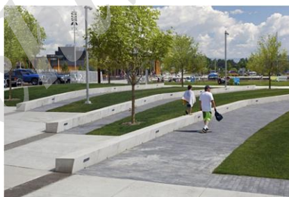
شکل ۱- پلازای شهری در انتاریو [17]