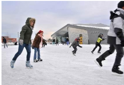
شکل شماره ۴- پارک در تورنتوی کانادا [18]

تصویر ۵، مرکزی برای خانواده واقع در کانادا است و فضایی در هماهنگی با ریتم طبیعی اطراف آن می باشد.