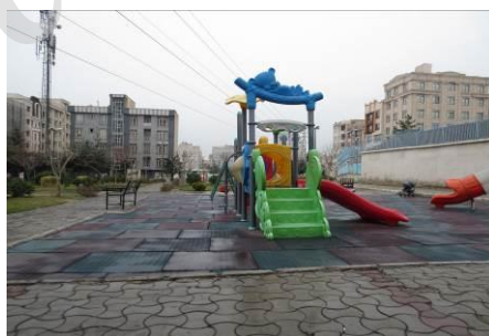
شکل ۱۳- پارکی در منطقه ۲ شهر تهران

تصویر ۱۳ مربوط به فضا و مبلمان بازی کودکان است که بدون داشتن طراحی مناسب کودک و فضا، بصورت آماده و پیش ساخته در محل نصب شده است.