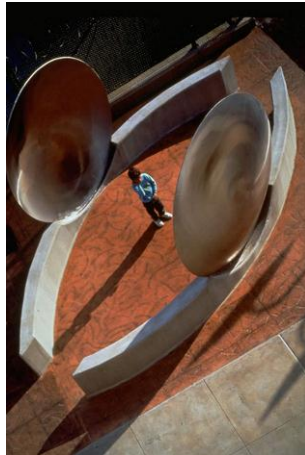
شکل ۶- محله PS 23 Sound در نیویورک [21]

پوست‌های آفریقایی تبار هستند لذا توجه به هویت و آداب و رسوم آنها از جمله مواردی است که در طراحی مورد نظر بوده است. لازم به ذکر است در این محله، فضاها و مبلمان شهری گوناگونی، برای گروه‌های سنی متفاوت کودکان در نظر گرفته شده، چرا که طبق نظریه رشد کودک، کودکان در سنین متفاوت قابلیت‌های کالبدی و ذهنی متفاوتی را دارند و هر چه سن آنها بیشتر می‌شود توانایی‌های کالبدی و رشد ذهنی آن‌ها افزایش پیدا می‌کند [۲۰]. تصویر ۷ و ۶: محله PS 23 Sound Playground, نیویورک آمریکا می‌باشد که آموزش محیطی و تجربه ترکیب اصوات را برای کودکان ممکن می‌کند.