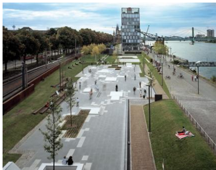
شکل ۱۰- پارک اسکیت در کلن آلمان [25]

مشخصی از روز مجاز به استفاده از این فضاها تفریحی می‌باشند [۲]. تصویر ۱۰ و ۱۱، پارکی است طراحی شده برای اسکیت که عناصر و مصالح به کاررفته در آن در فصول مختلف سال از استحکام کافی برخوردار بوده و فضایی ایمن را برای اسکیت سواری فراهم می‌کند. در عین حال دارای ارتفاع‌های مختلفی است تا هنگام پرش و فرود چشم اندازه‌های سبز و درختان پارک به زیبایی در معرض دید قرار بگیرد.