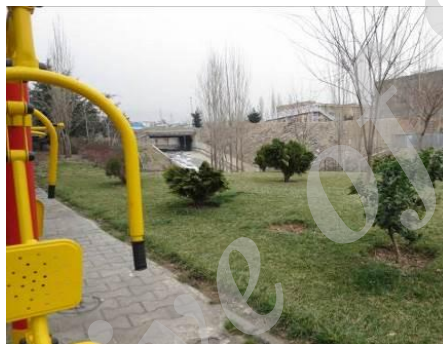
شکل ۱۲- فضای بازی کودکان در منطقه ۲ شهر تهران

در تهران، شرایط شهرسازی برای پرورش کودک آمادگی لازم را نیافته است [۲]. از سوی دیگر، کودکان تهران با این شهر آشنایی کامل ندارند، آنان حداکثر محیط پیرامون خانه خود و یا خیابان‌هایی را که بنا بر دلایلی مورد استفاده قرار می‌گیرد، می‌شناسند و با بقیه شهر آشنایی ندارند. از همین روی معابر و بافت‌های شهری و علائم راهنمایی و جهت دهنده، برای کودکان تهران خوانا نیست. آنچه که در این شهر ساخته شده برای بزرگسالان است. اصولاً کودکان در زمینه‌های مختلف در عرصه حرکت در خیابان، در فضاهای زندگی و تماس خانوادگی و در زمینه‌های شخصیت دادن به خود با مشکل مواجه می‌باشند [۲]. شرایط پریاهوی تهران، حجم ساختمان‌ها که بر اغلب آنها دود و گرد و غبار ناشی از آلودگی هوا نشسته، تابش نور بیش از حد در معابر عمومی و کمبود آن در ساختمان‌های مسکونی همجوار با هم، جایی برای آنکه کودک معصوم طبیعت را در آن پیدا کند، باقی نگذاشته است [۲]. علی‌رغم وجود تأسیسات و نهادهای مرتبط با کودک، هنوز سهم عمده‌ای از کودکان تهران از امکانات اجرایی زیستی و حقوقی که لزوم آن برای هر جامعه‌ای ضروری است، برخوردار نمی‌باشند [۲]. از جمله نهادهای بین‌المللی موجود در تهران که در کتاب آماده سازی شهر برای کودکان (اسماعیل شیعه) آماده است می‌توان به این موارد اشاره کرد: صندوق بین‌المللی فوق‌العاده سازمان ملل متحد برای کودکان (UNICEF) و آی‌سی‌سکو (ISESCO). تصویر ۱۲ پارکی است در منطقه ۲ شهر تهران که قسمت اختصاص یافته به فضای بازی کودکان در نزدیک رودی بدون در نظر گرفتن بخش امنیتی و حریم قرار گرفته است که می‌تواند ایجاد خطر کند.