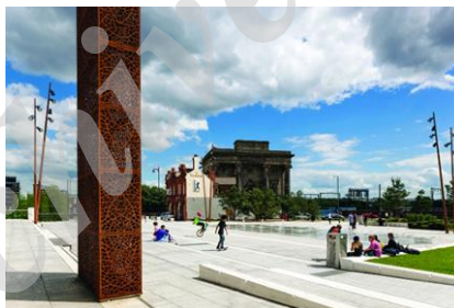
شکل ۹- پارک "است‌سایدسیتی" در بیرمنگهام [24]

در لندن، مناطقی وجود دارد که مختص کودکان می‌باشد که زندگی واقعی در جهان را برای کودکان ۴ تا ۱۴ سال معرفی می‌کند جایی که آنها می‌توانند بازی و کشف کرده و دنیای بزرگسالی را آموزش دیده و تجربه کنند. کودکان می‌توانند بیش از ۶۰ فعالیت مختلف بر اساس شرایط، دنیای کار واقعی را امتحان کرده و با کارهایی مثل خلبانی، مجری‌گری تلویزیون، دندانپزشکی و آتش‌نشانی آشنا شوند. دیگر محل‌های کار شامل تئاتر، ایستگاه رادیویی، بانک و ... است که در آن کودکان می‌توانند مدیر، کارمند و هر نقش متناسب دیگری را برعهده بگیرند. برای این تلاش کودکان پول نیز پرداخت می‌شود و کودکان می‌توانند پول خود را در بانک گذاشته و سپس از دستگاه پول خود را برداشته و غذا، هدیه و ... تهیه کنند. چنین مکان‌هایی با تاکید بر آموزش از طریق عمل و دادن نقش دیگری به کودکان، آنها را وادار به تصمیم‌گیری برای خود می‌کند [23]. تصویر ۹، مربوط به پارک شهر بیرمنگهام است که ساختار آن به گونه‌ای است که پیوند عابر پیاده را با مرکز شهر فراهم می‌کند. و دارای مسیرهای دوچرخه با هدف کاهش اتکا به اتومبیل است.