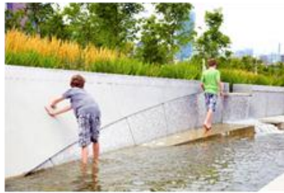
شکل ۳- پارک در تورنتوی کانادا [18]

تصاویر ۳ و ۴ منطقه ای است در مرکز شهر تورنتو (Toronto) کانادا که یک پارک شهری چند وجهی محسوب می شود. در این پروژه به انعطاف پذیری و تنوع به عنوان اصول اساسی در طراحی پارک توجه شده است. در عین حال که یک فضای آرام برای فرار از هرج و مرج از زندگی شهری است از سوی دیگر فضایی برای تعامل اجتماعی نیز می باشد.