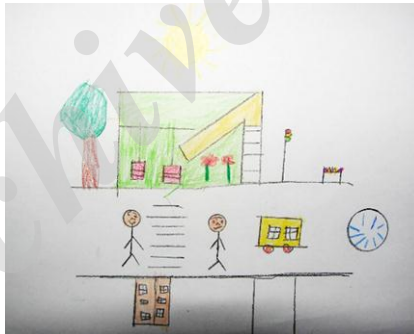
شکل ۱۶- نمونه نقاشی کودکان

در این نقاشی‌ها به مواردی چون تنوع رنگ، زمین‌های بازی، هوای پاک، امنیت، فضای سبز و جریان آب تأکید بسیار شده است. که میزان اهمیت هر یک از شاخصه‌ها از نگاه کودکان متفاوت می‌باشد (شکل شماره ۱۷).