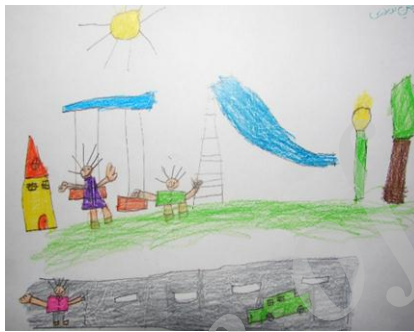
شکل ۱۵- نمونه نقاشی کودکان

در این تحقیق برای شناخت نیاز و انتظار کودکان از فضای شهری پیرامونشان از تکنیک نقاشی استفاده شده است که بهترین راه برای آشنایی با نظرات آنهاست زیرا بیشتر کودکان به نقاشی کردن علاقمند هستند و آن را محل مناسبی برای خواسته‌ها و آرزوهای خود می‌دانند. از این رو از پنجاه کودک ساکن تهران در رده سنی بین هفت تا دوازده سال خواسته شده است که فضای شهری دلخواه خود را نقاشی کنند (تصاویر ۱۵ و ۱۶).