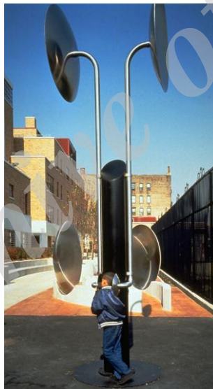
شکل ۷- محله PS 23 Sound در نیویورک [21]