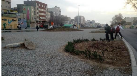
شکل ۱۴- محل سابق قرار گیری ریل راه آهن در منطقه ۱۷ شهر تهران