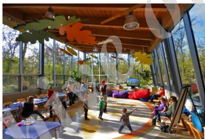
شکل ۵- مرکز خانواده در وینیپگ کانادا [19]

تصویر ۵، مرکزی برای خانواده واقع در کانادا است و فضایی در هماهنگی با ریتم طبیعی اطراف آن می باشد.