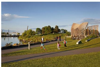
شکل ۲- پلازای شهری در انتاریو [17]