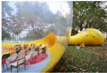
شکل ۸- Second Dome در لندن [22]

تصویر ۸ فضایی است جهت برگزاری رویدادهای اجتماعی رایگان برای خانواده‌های محلی و کودکان که شامل کارگاه‌های آموزشی انیمیشن، نمایش فیلم، آزمایش‌های علمی و ... که در ۱ اکتبر سال ۲۰۱۶، با ساختاری که به سرعت می‌توان آن را مونتاژ کرد برای حمایت رایگان از جوامع محلی و فضاهای مدنی راه اندازی شد.