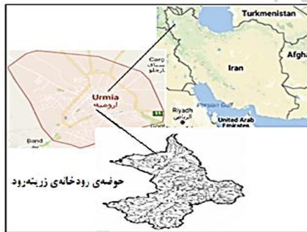
شکل ۱- موقعیت رودخانه زرینه‌رود بر روی نقشه

حوضه آبریز رودخانه زرینه‌رود در شمال غربی ایران و در جنوب شرقی دریاچه ارومیه واقع شده است. این حوضه آبریز در مختصات جغرافیایی ۴۵ درجه و ۴۵ دقیقه تا ۴۷ درجه و ۱۵ دقیقه طول شرقی و ۳۵ درجه و ۳۰ دقیقه تا ۳۶ درجه و ۴۵ دقیقه عرض شمالی گسترده شده است. مساحت حوضه آبریز زرینه‌رود حدود ۱۳۸۹۰ کیلومتر مربع است. میانگین سالانه دما در محل سد زرینه‌رود ۱/۸- درجه سانتی‌گراد برآورد شده که از حدود ۲۶/۵ درجه سانتی‌گراد درجه سانتی‌گراد در بهمن ما تا ۵ در مرداد ماه متغیر است. در شکل ۱ موقعیت رودخانه زرینه‌رود بر روی نقشه نشان داده شده است.