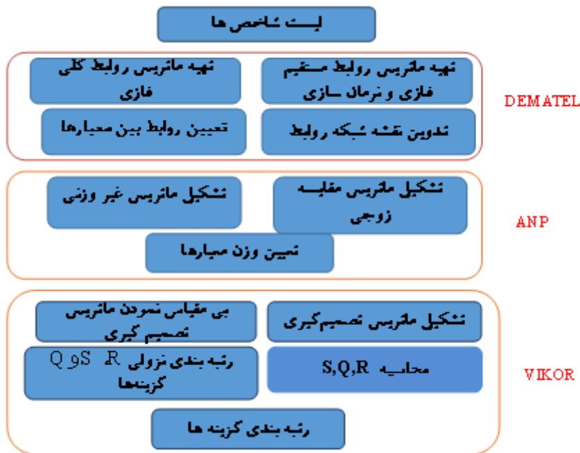
شکل ۱- فرآیند کلی روش پژوهش

در شکل (۱) به فرآیند کلی روش انجام پژوهش اشاره شده است: