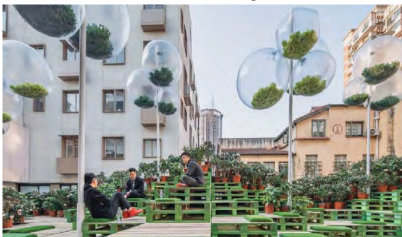
شکل ۶- پروژه Urban Bloom، چین