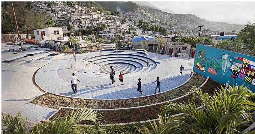
شکل ۱- پروژه Tapis Rouge، هائیتی

نقطه شروع مهم در ایجاد مفهوم برای هر فضای عمومی شهری، شناسایی هویت و پتانسیل های موجود در سایت است. افرادی که دید تاریخی، بینش های ارزشمند در مورد نحوه عملکرد منطقه، درک مسائل مهم و آنچه برای آنها معنی دارد، پیدا کنند به نتیجه می رسند.