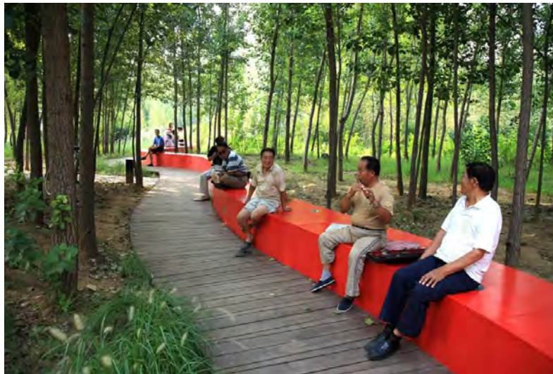
شکل ۹- پروژه روبان قرمز، چین

بازخورد از اجتماع و شرکای بالقوه، درک نحوه عملکرد سایر فضاها، تجربه و غلبه بر موانع و انتقادات مفهوم فضا را فراهم می کند. اگرچه طراحی مهم است، اما الزامات دیگری به شما می گویند برای تحقق بخشیدن به چشم انداز آینده برای فضا به چه مواردی نیاز دارید.