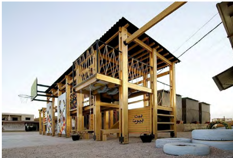
شکل ۱۰- پروژه CatalyticAction، لبنان

طرح CatalyticAction در یکی از مدارس توسعه یافته در سکونتگاه های پناهندگان در کشور لبنان، یک زمین بازی را طراحی و ساخته است، که کودکان را در کل مراحل درگیر می کند و اجازه می دهد تا ساختار طرح به راحتی از هم جدا شود، جا به جا شود، یا مجدداً ساخته شود و در کل تغییر شکل بدهد. این پروژه می کوشد تا این مفهوم را به چالش بکشد و حوادثی را که در مواقع اضطراری، ضروری به نظر می رسد گسترش دهد و تعریف یک زمین بازی را در پاسخ اضطراری زیر سؤال ببرد. این پروژه امکانات بازی و همچنین این کودکان را ترغیب می کند تا خودشان زمین بازی را طراحی کنند.