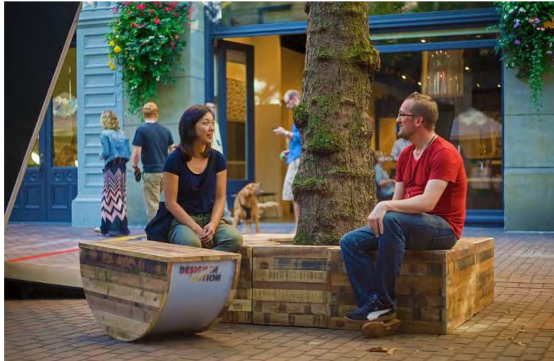
شکل ۷- پروژه Pop-Up! Street Furniture، آمریکا

طرح سه گوش، طبق گفته Holly Whyte، روندی است که بوسیله آن برخی محرک های خارجی پیوندی بین افراد ایجاد می کند و افراد غریبه را ترغیب می کند تا با هم صحبت کنند، گویی که آنها یکدیگر را می شناسند. در یک فضای عمومی شهری، انتخاب و ترتیب عناصر مختلف در رابطه با یکدیگر می تواند فرآیند طرح سه گوش (مثلث بندی) را به حرکت درآورد و افراد را به هم نزدیک کند.