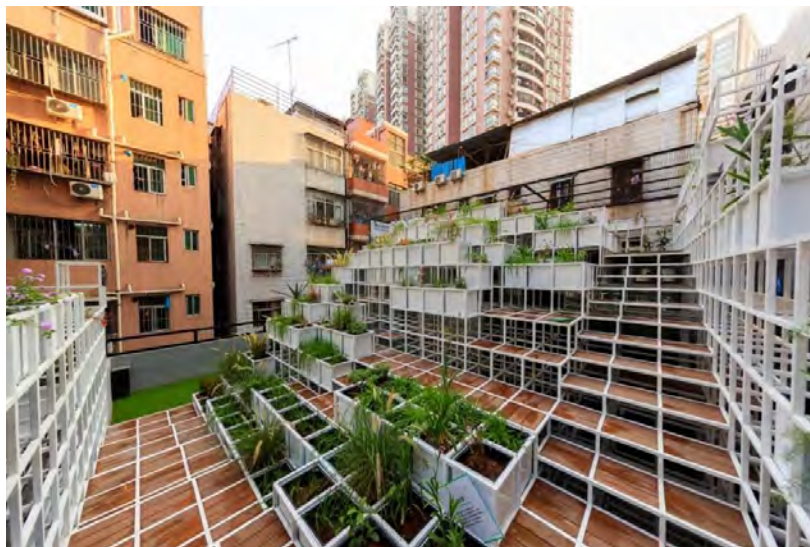
شکل ۱۱- پروژه Green Cloud، چین

امکانات فرسوده می شود و نیاز به اصلاح و نوسازی در یک محیط شهری احساس می شود. آغاز حس نیاز به تغییر و داشتن انعطاف پذیری مدیریتی برای تصویب آن تغییر، چیزی است که باعث ایجاد فضاهای عمومی و شهرهای کوچک و بزرگ عالی می شود.