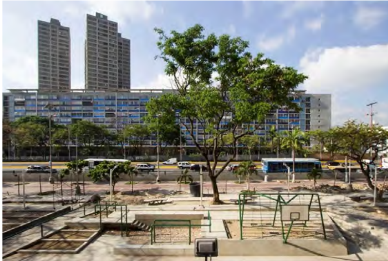
شکل ۳- پروژه Urban Amenities، ونزوئلا

Urban Amenities پروژه ای است که در آن شرکای زیادی برای ایجاد مداخله در طرح همکاری می کنند. این پروژه توسط شهرداری کاراکاس و به همراه ماموریت اجتماعی دانش و کار، سازمان Pico Collective راه اندازی شده و با حمایت جامعه سازمان یافته از منطقه، پروژه نوسازی فضاهای شهری عمومی و تفریحی را برای محیط های شهری مختلف ایجاد می کند. در طی فرآیند، نمایندگان مراکز زیربط طرح اولیه را با کارشناسان انتخاب کردند.