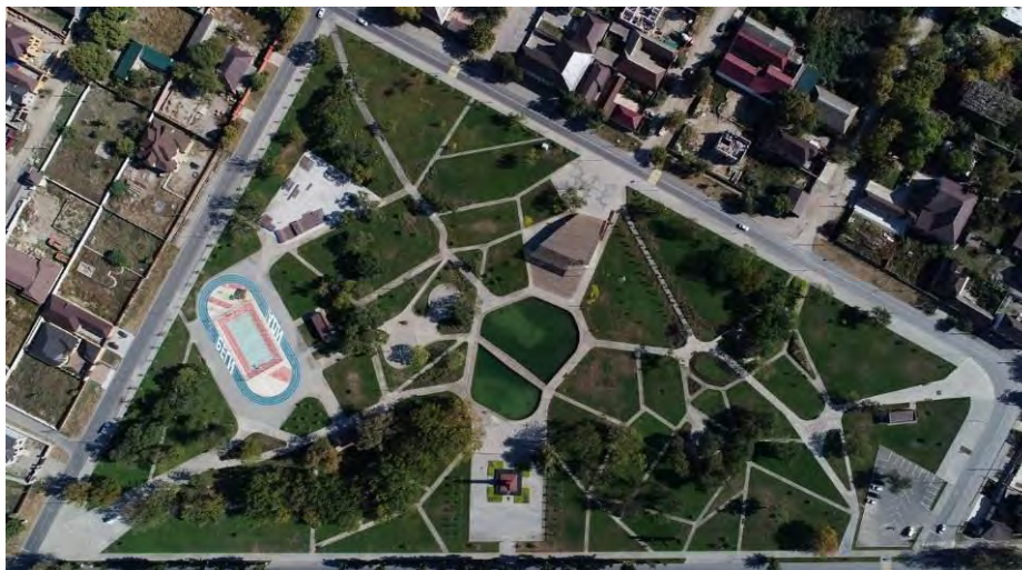
شکل ۵- پروژه پارک حسین بن تلال، روسیه

هویت مکان یک پروژه یا فضا باید از بافت پیرامونی آن مکان استخراج شود تا احساس مالکیت و حس غرور را در افرادی که در مناطق اطراف زندگی و کار می کنند، القا کند. همراه با این ایده، نوع فعالیت ها و تصویر اولیه پروژه بوجود می آید.