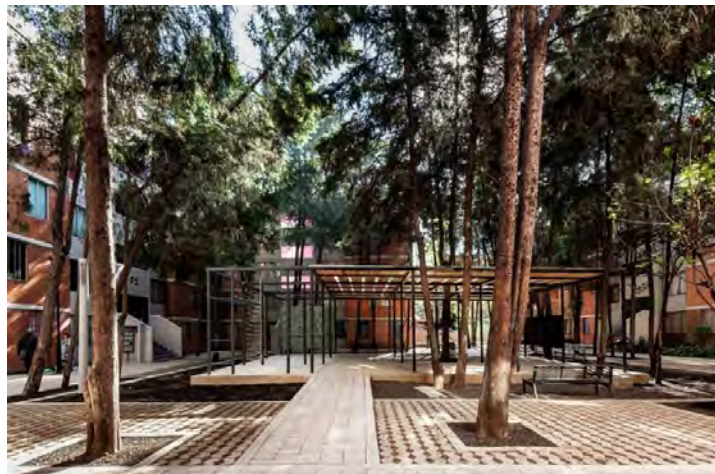
شکل ۸- پروژه San Pablo Xalpa، مکزیک

هنگام ساخت فضاهای عمومی شهری خوب، برخورد با انواع موانع اجتناب ناپذیر است، زیرا "ایجاد مکان ها" کاری نیست که برخی از متخصصان بتوانند انجام دهند. با یک فرآیند پیچیده تر، بهبود های کوچک در پرورش اجتماع می توان اهمیت "مکان ها" را نشان داد و به غلبه بر موانع کمک کرد.