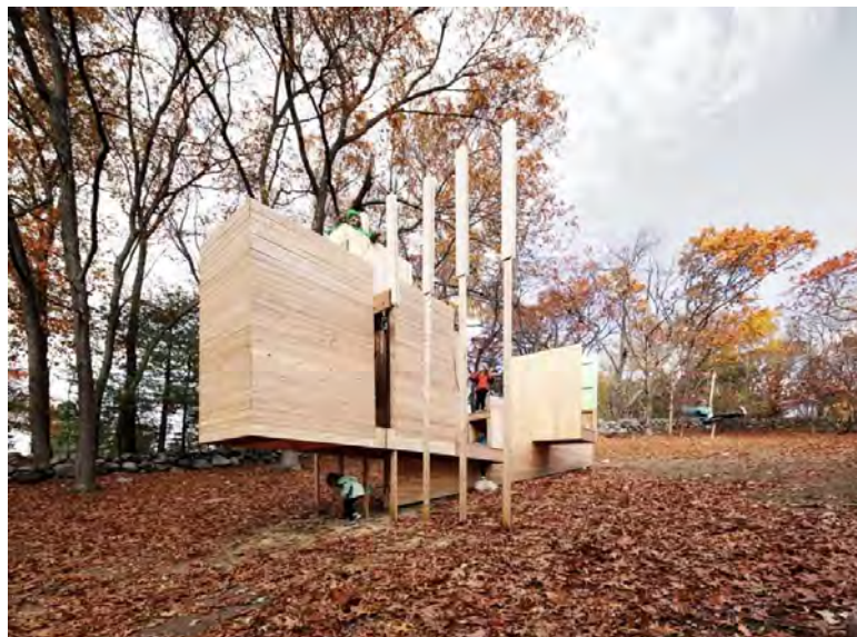
شکل ۴- پروژه Five Fields، آمریکا

با بررسی چگونگی استفاده یا عدم استفاده مردم از فضاهای عمومی، مشخص خواهد شد که چه نوع فعالیت هایی وجود ندارند و چه چیزی باید در آن گنجانده شود. علاوه بر این، هنگامی که این فضاها ساخته می شوند، ادامه مشاهدات، بینشی در مورد نحوه مدیریت آنها و تکامل آنها به مرور می دهد.