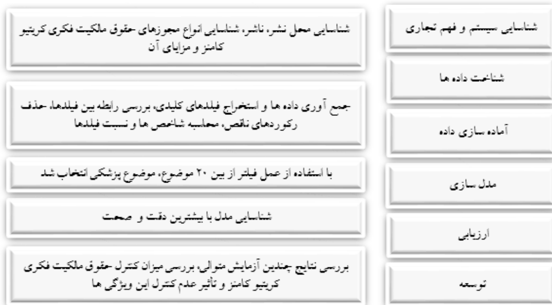
نمودار ۱. مدل کریسپ و مدل پیشنهادی (۲۷)