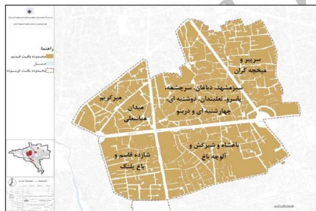
نقشه ۲: محدوده عملکردی امروزی محله دربنو و دیگر محلات قدیمی گرگان