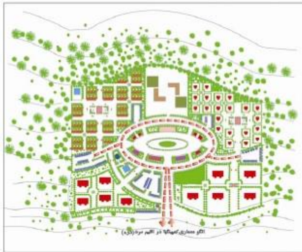
الگوی معماری در کمپینگ‌ها در اقلیم سرد (دره)

استقرار کاربری‌ها در امتداد جبهه جنوبی و بصورت خطی می‌باشد. در الگوی خطی نمی‌توان نقاط مرکزی متعدد ایجاد نمود. کمپینگ‌های واقع در دره با توجه به ضرورت‌های اقلیمی و حفاظت از خدمات اصلی از الگوی توسعه متمرکز تبعیت می‌کند. کاربری‌های اقامتی و تفریحی به عنوان دیواری محافظ برای خدمات اصلی مانند ساختمان‌های مدیریتی و پذیرایی می‌باشد. همچنین در این الگو توسعه فضایی در امتداد دره امکانپذیر خواهد بود. کمپینگ‌های واقع در دشت با توجه به اینکه امکان ایجاد دسترسی‌های شمالی جنوبی وجود دارد، امکان تلفیق در الگوی شطرنجی ستاره‌ای در الگوی استفاده از اراضی وجود داشته و الگوی ستاره‌ای موجب ایجاد مراکز فرعی در هر یک از موقعیت‌های استقرار فضایی کاربری‌ها می‌گردد و الگوی شطرنجی ساختار شبکه دسترسی را تعیین می‌کند استفاده تلفیقی از این الگو موجب حفظ کاربری‌ها از باد سوزان و عبور آن از درون شبکه دسترسی‌ها می‌گردد و همچنین تابش آفتاب تاثیر فرسایشی اندکی بر کاربری‌ها خواهد داشت.