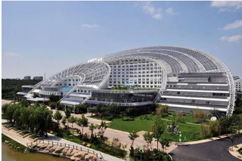
شکل ۲. تصاویری از ساختمان پایدار عمارت ماه و خورشید (ویکی پدیا، ۱۳۹۸)

عمارت خورشید و ماه بزرگترین بنای خورشیدی جهان در ۲۷ نامبر سال ۲۰۰۹ در منطقه دزهو (ایالت شانگدون در شمال غرب چین) است. این بنا در ۷۰۵ هکتار ساخته شده که شامل یک ساختمان اداری، یک هتل، یک نمایشگاه و یک سالن اجلاس می باشد. که کل آب گرم مجموعه توسط آبگرمکن های خورشیدی تأمین می شود. این ساختمان یک مکعب مستطیل ساخته شده ولی بام این ساختمان پوشش نیم دایره ای دارد که صرفاً جهت کار گذاشتن پنل های خورشیدی می باشد.