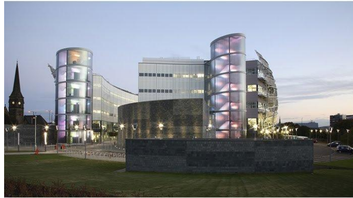
شکل ۴. تصاویری از ساختمان پایدار پردیس دانشگاهی بریتانیا (دیجی کالا، ۱۳۹۴)

بخشی از «دانشگاه نورثاومریا» (Northumbria University) انگلستان به نام کمپ شرقی خوانده می‌شود. این کمپ خاستگاه یکی از نخستین بناهای اروپا است که بر اساس استانداردهای زیست‌محیطی ساخته شده است. پس از آنکه پروتکل کیوتو در سال ۱۹۹۷ م. (۱۳۷۶ ه.ش.) کاهش گازهای گلخانه‌ای و مبارزه با تغییرات جوی را الزامی دانست، دست اندرکاران این پروژه شروع به ساخت پردیسی متفاوت کردند. این مجموعه در سال ۲۰۰۷ م. (۱۳۸۶ ه.ش.) تکمیل شد و در حال حاضر خوابگاه بیش از ۹ هزار دانشجو است. در سال ۲۰۱۱ این ساختمان به دلیل کاهش تولید گاز دی‌اکسید کربن موفق به دریافت جایزه‌ای تحت همین عنوان شد.