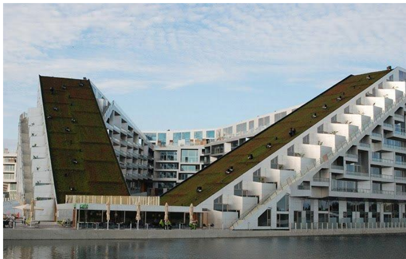
شکل ۳. تصاویری از ساختمان پایدار مرکز تجاری کپنهاگ (دیجی کالا، ۱۳۹۴)

پشت بام های سبز این شهرک می تواند باعث انعکاس امواج مضر خورشید و خنک شدن هرچه بیشتر محیط شود. این شهرک در حومه شهر واقع شده و برای دسترسی به آن تنها ۱۰ دقیقه زمان کافی است تا یک مسافر بتواند از شهر کپنهاک خود را به این مجموعه برساند. این شهرک عظیم ۵۰۰ واحدی یک مجتمع بزرگ تجاری را نیز در خود جای داده است. از آنجا که ساکنان می توانند کلیه خریدهای خود را از این محل انجام دهند لذا از میزان مصرف بنزین نیز به شدت کاسته شده است. شهرک در سال ۲۰۱۰ م. (۱۳۸۹ ه.ش.) رسماً افتتاح شد. در این شهرک ۱۸ هزار فوت مربع (برابر با ۱۷۰۰ متر مربع) پشت بام سبز تعبیه شده که می تواند باعث انعکاس امواج مضر خورشید و خنک شدن هرچه بیشتر محیط شود.