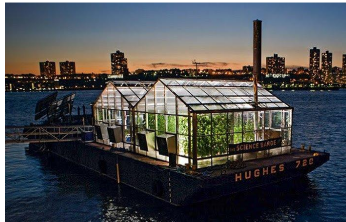
شکل ۵. تصاویری از ساختمان پایدار خانه‌ی متحرک نیویورک (دیجی کالا، ۱۳۹۴)

خانه‌ی متحرک نیویورک که از آن با نام «کشتی علم» (Science Barge) هم یاد می‌شود در واقع یک کلاس درس آموزشی و یک خانه‌ی سبز منطبق با اصول زیست‌محیطی است که منطبق با ضوابط هیئت ساختمان‌سازی سبز تجهیز و سازماندهی شده است. سوخت لازم برای این مجموعه از نور خورشید، باد و سوخت‌های بیولوژیکی تامین می‌شود. این بنا در سال ۲۰۰۷ م. (۱۳۸۶ ه.ش.) ساخته شده و به واسطه طراحی منحصر بفردش در عمل هیچ گاز دی‌اکسید کربنی از آن به خارج منتشر نمی‌شود.