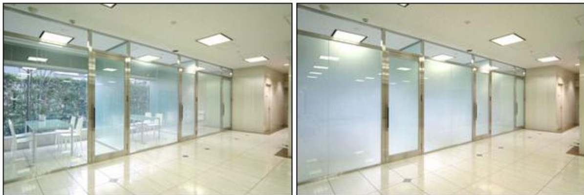
شکل ۲: حالت کدر و شفاف برای شیشه الکتروکرومیک که با زدن یک کلید تغییر می کند. (سرخوش و توکلی دستجردی. ۱۳۹۲)

شیشه های هوشمند ( نوع کریستال مایع ) ساختمان درونی این شیشه تشکیل شده از دو لایه شفاف قلع به عنوان الکتروود می باشد که لایه ای از کریستال مایع بین آنها ساندویچ شده است. ( سرخوش و توکلی دستجردی ، ۱۳۹۲ )