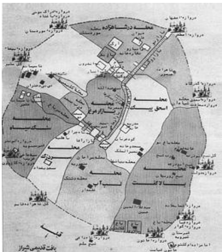
شکل ۱- نقشه بافت تاریخی شیراز (ماخذ: تاریخ بافت قدیمی شیراز از کرامت اله افسر)

بافت تاریخی شهرها دارای مشخصاتی چون قدمت تاریخی، بافت فشرده و در هم تنیده می باشد و وجود بافت تاریخی متمایز از سایر بافت های شهر بر اهمیت و جذابیت آن شهر می افزاید و کل بافت تاریخی شهر را به عنوان یک جاذبه مطرح می کند. بافت تاریخی از مهمترین بخش های هویتی هر جامعه محسوب می شود که مجموعه ای منسجم از معماری، فرهنگ، اقتصاد و تبادلات اجتماعی یک ساختار شهری را در بر دارد (آزادی، ۱۳۹۴: ۱۱). منطقه تاریخی و فرهنگی شهر شیراز با وسعت تقریبی ۳۷۸ هکتار، بخشی از محدوده مرکزی شهر شیراز را شامل می شود که امروزه منطقه ۸ شهرداری شیراز را تشکیل داده و خود دارای شهرداری مستقل می باشد. این منطقه علاوه بر این که هسته اولیه پیدایش شهر شیراز بوده، در حال حاضر نیز بسیاری از فعالیت های مرکزی تجاری، مذهبی، خدماتی و اداری را در خود جای داده و ظرفیت های بالفعل و بالقوه قابل توجهی جهت رونق فعالیت های سیاحتی، زیارتی، تجاری، فرهنگی و مسکونی دارد (وارثی و دیگران، ۱۳۹۱: ۱۱). بافت تاریخی شیراز تا زمان قاجار دارای محلات مختلفی بوده و کلانترهایی این محله ها را اداره می کردند. فارسنامه ناصری تالیف میرزا حسن فسایی حسینی این محلات را به طور مفصل توضیح داده است. او در این کتاب از محلات درب شاهزاده، سنگ سیاه، لب آب، بالاگفت، اسحق بیگ، سر باغ، سردزک، درب مسجد، میدان شاه، بازار مرغ، صحبت کرده و تعداد جمعیت، بناها و علمای این محلات را شناسایی و توضیح داده است. این بافت با ارزش دارای جاذبه های بسیار مهمی از اوایل اسلام تا دوران قاجار است و نقش مهمی در جذب گردشگران دارد.