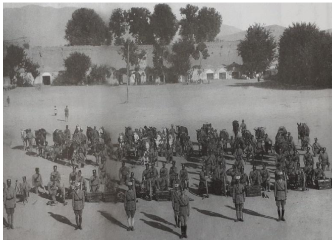
شکل ۲- میدان توپخانه شیراز

کرزن که در دوره قاجار به شیراز می آید، در توصیف بناهای شیراز به استقرار تلگرافخانه در شمال میدان اصلی شهر که در مجاورت ارگ حکومتی قرار داشته اشاره کرده است. او از میدان توپخانه نام نبرده ولی به حضور توپ در میانه میدان اشاره کرده است (کرزن، ۱۳۷۳: ۱۱۵). او می نویسد: ((در یک جبهه قصر، میدان اصلی واقع است که محوطه ای مخروطی و متروک است و چند عدد توپ هم آنجاست)) (کرزن، ۱۳۷۳: ۱۱۶). کرزن در ادامه زمانی که از بازار وکیل صحبت می کند به این نکته اشاره دارد: ((از میدان، به بازار وکیل راه هست)) (کرزن، ۱۳۷۳: ۱۱۶). این نکته نشان می دهد که در آن زمان راهی از میدان توپخانه به بازار وکیل بوده که امروزه بسته شده است. محل فعلی این راه به احتمال زیاد نزدیک دبیرستان شاهپور بوده که امروزه تخریب شده است. افسر در کتاب ((تاریخ بافت قدیمی شیراز)) به نقل از کتاب گیتی گشا می نویسد: ((رای عالم آراء و اندیشه صواب نما این اقتضاء نمود که به معماری همت بلند و به دستیاری عزم و اراده ارجمند در اندرون شهر شیراز تاسیس چهار بازار و میدان و عمارتی استوار به جهت دیوانخانه همایون فرمایند)) (افسر، ۱۳۵۳: ۷۹).