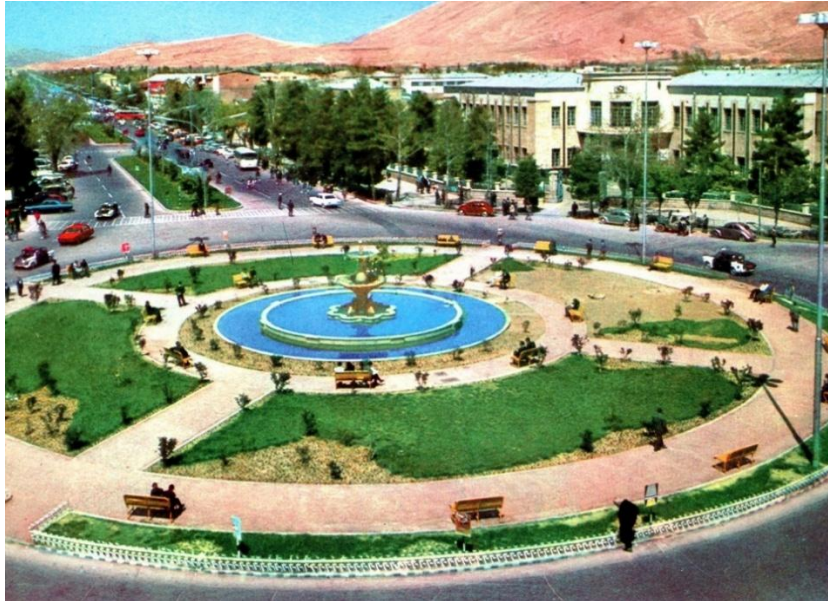
شکل ۴- میدان شهرداری شیراز

میدان شهرداری یا شهدا یکی از میدان های جدید شیراز محسوب می گردد که در ساخت و سازهای دوران پهلوی ساخته شده و به واسطه ساختمان شهرداری مرکزی یا بلدیة قدیم به این نام معروف شده است. در زمان قدیم و در دوران زندیه، تاسیسات زندی در این قسمت قرار داشته که در دوران قاجار و پهلوی به مرور تخریب و به این شکل درآمده است. با تاسیس شهرداری یا بلدیة قدیم، نام این میدان کم کم به میدان شهرداری تبدیل شد.