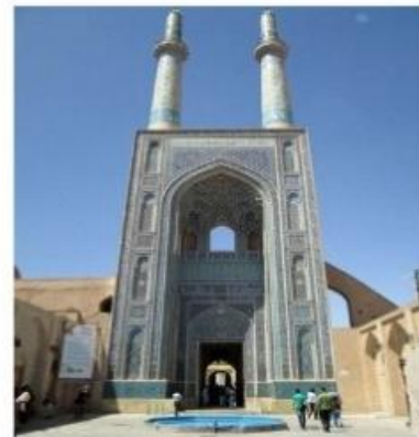
شکل شماره ۲: تزئینات و الحاقات مخالف با دستورات اسلام در مسجد شیخ زاهد و سردر ورودی مسجد جامع یزد (عصر ایران، ۱۳۹۹)