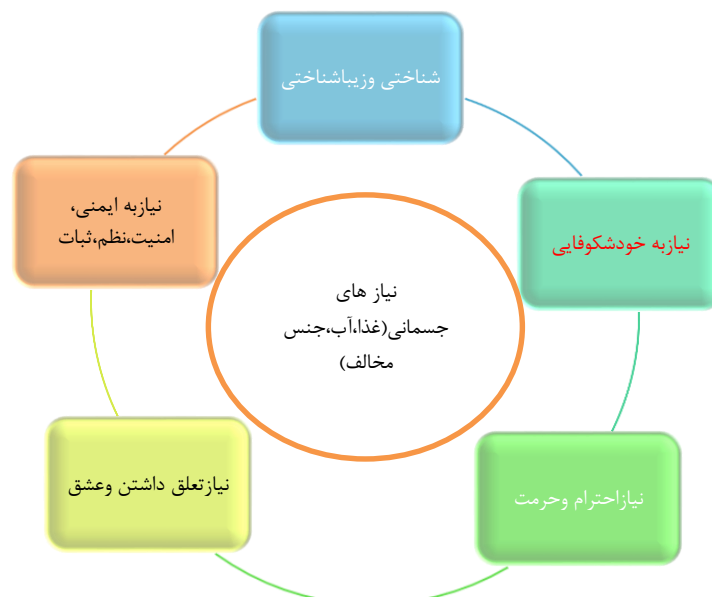
نمودار شمار ۴: سلسله مراتب نیاز های انسانی مازلو (پاکزاد، ۱۳۹۱)

مازلو معتقد است که انسان ها نیاز های مختلفی دارند این نیازها نه به صورت بی ارتباط و جدای از هم، بلکه به صورت سلسله مراتبی از نیازها در طول زندگی فرد بروز می‌آیند (پاکزاد، ۱۳۹۱).