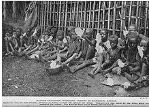
تصویر شماره ۲: وضعیت کودکان کار (و معماری زاده، ۱۳۹۵)

کودکان خیابانی به عنوان بخشی از سرمایه انسانی هستند که سلامت جسم و روان آنها می تواند نقش مهمی در سلامت جامعه داشته باشد. طبق نظر یونیسف، کودکان خیابانی با واقعیت تلخ جدایی از خانواده و خطر از دست دادن امکانات اساسی همچون آموزش و بهداشت مواجه اند. دونالد استوارت اعتقاد دارد که فقدان یا از دست دادن روابط بسنده با یکی از والدین از نظر بهداشت روانی یکی از بزرگترین مشکلات کودکان خیابانی است. این کودکان با مشکلات بهداشتی، بیماری، حفظ سلامت روانی، مشکلات روانشناختی و عدم پیشرفت تحصیلی مواجه اند (صلاحی، ۱۳۷۹). در ایران ساماندهی این کودکان بر عهده سازمان بهزیستی میباشد. طبق آمار سازمان مذکور، تعداد کودکان کار در سال ۱۳۸۴، ۷۸۴ نفر بوده است. تفاوت فاحش میان آمار کودکان کار که تحت پوشش بهزیستی قرار می گیرند با آمار تخمین زده شده توسط کارشناسان، نشانگر مخفی بودن تعداد قابل توجهی از این کودکان است. بر اساس یک سرشماری انجام شده در کشور ایران، حدود ۱۲٪ از جمعیت ده تا نوزده سال کشور ما فعالیت اقتصادی دارند