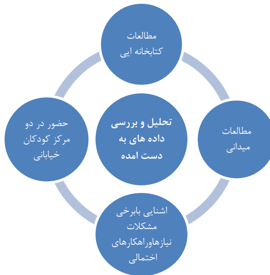
نمودار شماره ۱: روند شکل گیری طراحی

بدیهی است برای دستیابی به معیارها و مبانی طرحی که بتواند محیط مناسبی برای زندگی کودکان بی سرپرست فراهم آورده و راه حلی برای معضلات و مرکزی برای احقاق حقوقشان نیز باشد، شناخت کامل و کافی این کودکان، علل بی سرپرستی و ویژگی های روانی و رفتاری شان ضروریست. از سوی دیگر آنها فراتر از همه چیز کودکانی با نیازهای طبیعی سنشان می باشند پس لازم است با توجه به شرایط سنی و خصوصیات عام آنها کودک و ویژگیهای کودکی را بشناسیم. همچنین آشنائی با حقوق و قوانین مربوطه نیز ضروری است. این بخش با تحقیقات کتابخانه ای و بخشی نیز مصاحبه های میدانی با سرپرستان و مربیان این کودکان انجام خواهد شد. در سراسر دنیا می توان نمونه هایی از مراکز نگهداری کودکان بی سرپرست یافت. که شناخت و بررسی آنها می تواند پروژه را از تکرار خطاهای به اثبات رسیده مصون داشته و نقاط تأکید را روشن نماید. برای این بخش نیز علاوه بر منابع کتابخانه ای، مطالعات آماری بر مبنای آمارهای موجود در سازمان بهزیستی و سایر مراجع و مصاحبه با مسئولین و متخصصین امور نگهداری کودکان بی سرپرست و اطلاع از نظرات آنها در تشخیص روحیات و ویژگیهای این کودکان انجام شده است.