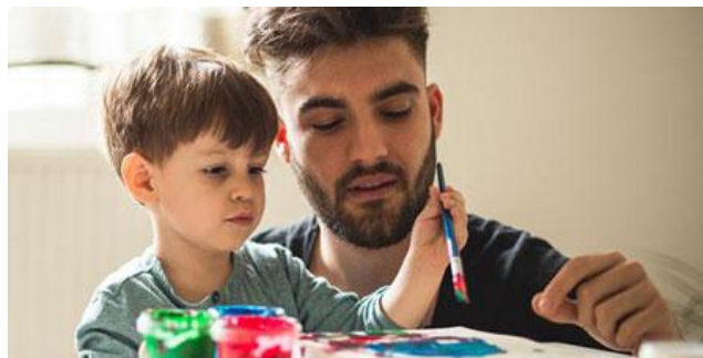
تصویر شماره ۴: کودکان والدین و نقاشی

کودک برای رشد ، قبل از هر چیز به ارضاء عاطفی و احس پیوند با محیط فیزیکی و اجتماعی خود نیازمند است . بنابراین مشخصه محیط مناسب ، وجود محرکها و انگیزه های لازم و منطبق با هر مرحله رشد کودک است . هنگام طراحی مفیدترین ترفند به منظور ایجاد پیوند عاطفی بین کودک و محیط و جلوگیری از روحیه ناخرسند در او ، در نظر گرفتن وابستگی ها و تمایلات جسمی و عاطفی کودکان در هر مرحله از رشد است . مساله مهم دیگر که در حفظ پیوند کودک با محیط و ایجاد حس امنیت روانی برای او مؤثر است ، وضوح و خوانایی محیط برای کودک می باشد . محیطی که آن را به سهولت درک و تعبیر نماید ، بنابراین یکی دیگر از ویژگیهای محیط مناسب ، انطباق داشتن با توانایی شناختی و ادراکی کودکان است در عین حال که به گسترش طرحهای ذهنی و شناخت آنان یاری رسانده بروز خلاقیت را ممکن می سازد . (بهزادپور ، ۱۳۹۸) .