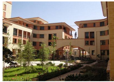
عکس (۲) - مجتمع مسکونی زیتون اصفهان - (منبع: www.iranshahrsaz.com)