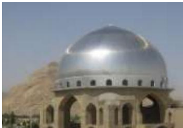
شکل شماره ۲: گنبد مسجد قدس (پناهی ۱۳۹۶، ۱۳)

مسجد قدس واقع در شهرستان تفت، دارای گنبدی با قطر ۳۱ متر و ارتفاع ۲۱،۲ متر، با یک شبکه فضاکار دولایه دارای اتصالات گوی سان طراحی گردیده است. این گنبد از نوع گنبد‌های اسلامی با قوس پنج و هفت می باشد. این مصلی فضای شبستانی حدود ۱۰۰۰ متر را داراست و این گنبد بزرگترین و مرتفع‌ترین گنبد استان محسوب میشود. گنبد به صورت یک پوسته بوده و با ورق استیل پوشیده شده است (پناهی ۱۳۹۶، ۱۳).