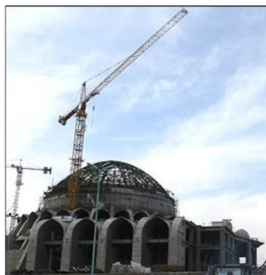
شکل شماره ۵: مصلاي امام خميني تهران (قبادیان ۱۳۹۴، ۳۰۳).

این مصلى یکی از بزرگترین ساختمانهای مذهبی در کشور از لحاظ وسعت و حجم کاری میباشد. ساختمان با طولی حدود ۵۰۰ و عرض ۴۰۰ متر می باشد. این ساختمان عظیم خصوصیات شیوه اصفحانی مانند گنبدها و گلدسته ها، حیاط مرکزی چهار ایوان، کاشی کاری، گچ بری و چوب بری با نقوش اسلیمی و گره چینی در نما و قسمت های دیگر ساختمان دیده می شود که از سازه ای بتنی و فلزی ساخته شده است. گنبد مصلى نار و یک پوسته بوده و سازه گنبد فلزی بوده و با بتن پوشیده شده است. قوس ها عمدتاً جناغی و از قوس های نیم دایره نیز استفاده شده است. ارتفاع ساختمان یادآور شیوه آذری است. دال های بتنی پیش تنیده امکان دهانه های بزرگ و عظیم را امکان ساز کرده است (قبادیان ۱۳۹۴، ۳۰۲).