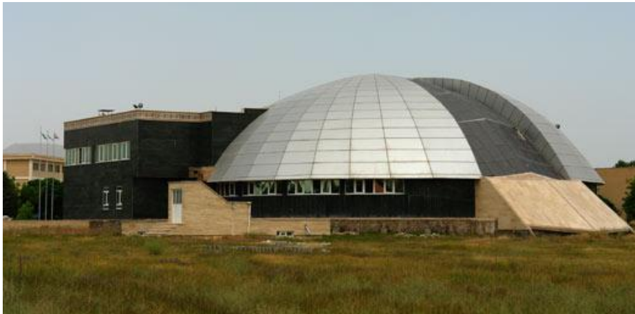
شکل شماره ۶: دانشگاه آزاد ابهر (پناهی ۱۳۹۶، ۱۵).

مسجد پیامبر اعظم (ص) در شهرستان ابهر با زیربنای ۲۴۱۲ متر مربع ساخته شده است. معماری این ساختمان به سبک نوین می‌باشد. گنبد این مسجد به صورت نار و یک پوسته بوده و گنبد نیم کره با سازه فلزی قاب خمشی و با پوشش آلکویاند و شیشه های مخصوص لمینیت ساخته شده است (پناهی ۱۳۹۶، ۱۵).