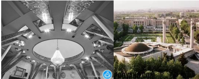
شکل شماره ۴: مسجد دانشگاه تهران (پناهی ۱۳۹۶، ۱۳).

در مهرماه ۱۳۴۵ مسجد دانشگاه افتتاح گردیده است و این مسجد از نظر فرم فضا و مصالح، سبکی متفاوت با سبک سنتی دارد. مسجد دارای یک گنبد بوده و سقف مسطحی اطراف گنبد قرار دارد. گنبد به صورت نار و یک پوسته میباشد و گنبد با سازه فلزی و بتن پوشانده شده است (پناهی ۱۳۹۶، ۱۳).