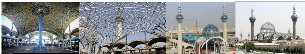
شکل شماره ۱: کاربرد نقوش هندسی (مصلی بزرگ اصفهان) (شهبازی و قلیزاده ۱۳۹۵، ۱۳)

این مصلی دارای بخش‌هایی همچون شبستان، مناره، مقصوره و رواق می‌باشد. گنبد فلزی مصلی، گنبد مقصوره نام دارد و دهانه آن ۴۰ متر و ارتفاع ۶۰ متر و با وزنی بالغ بر ۱۲۰۰ تن میباشد که با نصب شیشه‌ها بر روی گنبد وزن آن به ۲۰۰۰ تن خواهد رسید. فرم گنبد نار و یک پوسته می باشد و صحن اصلی شامل ۲۱ گنبد بتنی پیرامونی است که از شمال، شرق و غرب فضای میانی را در بر گرفته است و از جنوب به گنبد مقصوره متصل می شود (پناهی ۱۳۹۶، ۱۲).