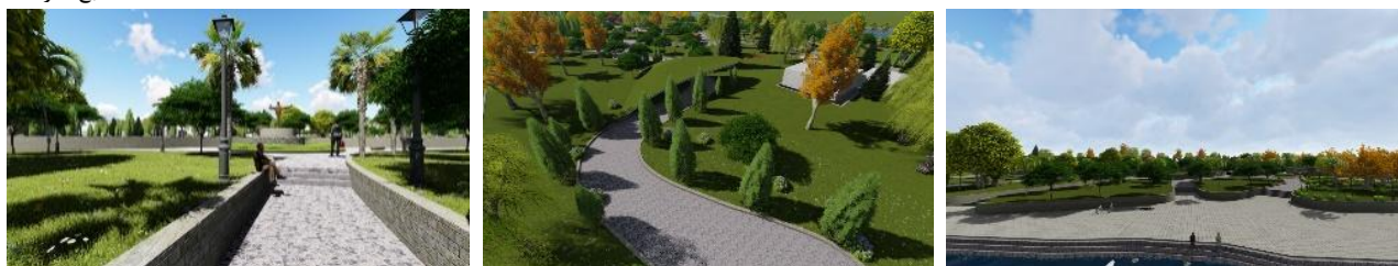
تصاویر ۴-۶: طراحی برای ارتقاء مولفه های عملکردی مانند تسهیلات لازم برای گذران اوقات فراغت و توجه بیشتر به مولفه های ادراکی